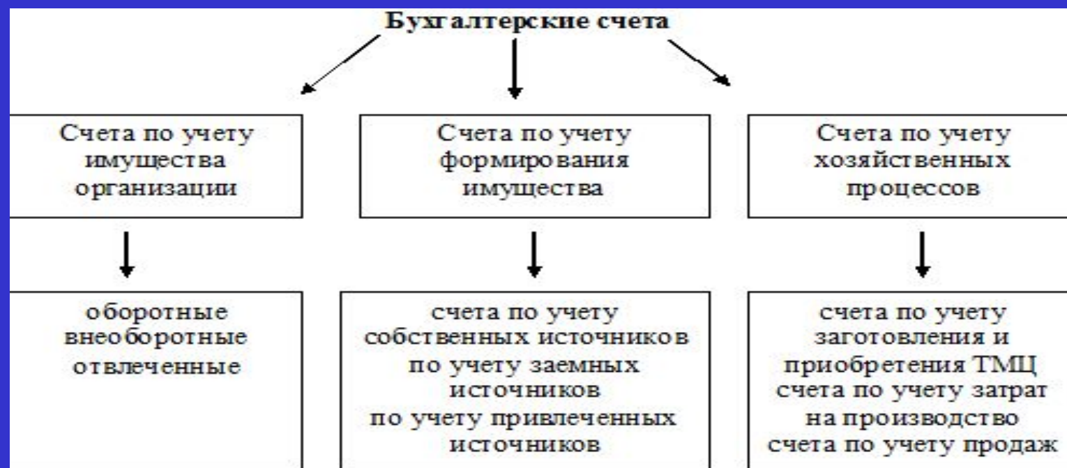
Рис. 1 Классификация счетов бухгалтерского учета по экономическому содержанию