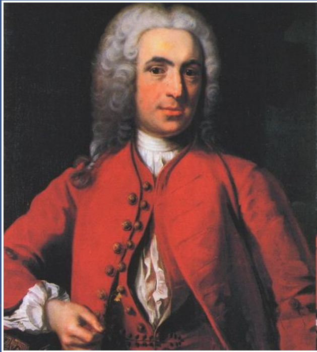
Карл Линней, 1707-1778