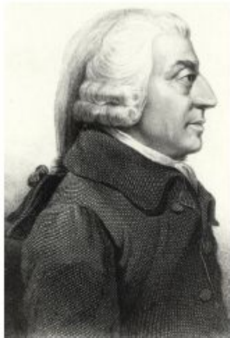
Адам Смит (1723-1790)

Шотландский экономист и философ, первый классик экономической науки. Источник увеличения богатства по Смиту – повышение производительности труда, что достигается путем разделения труда. В свою очередь, причиной разделения труда является обмен.