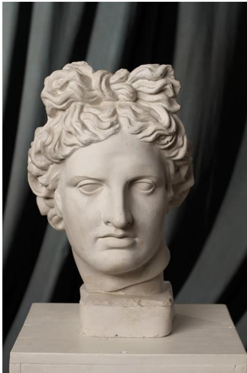
Рисующий и фоновой источники света