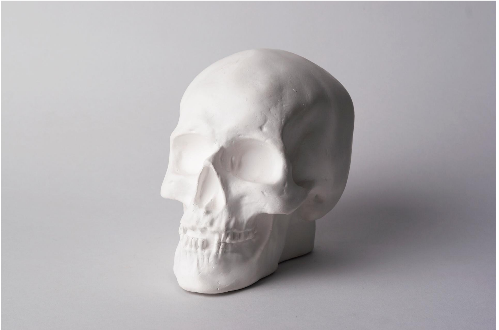
Передне-боковое освещение (45 °); пример мягкого освещения.