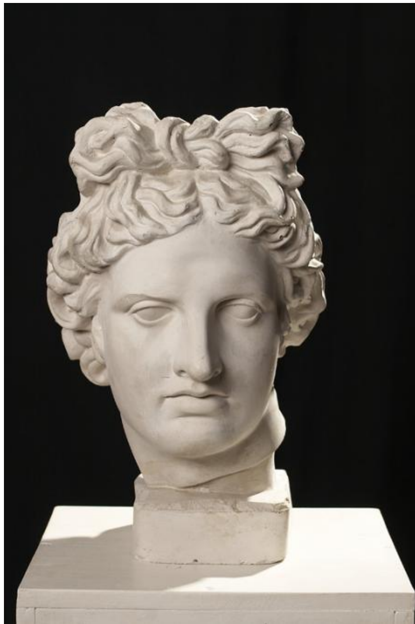
Рисующий и контрольной источники света