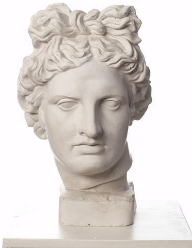
Рисующий и фоновой., света