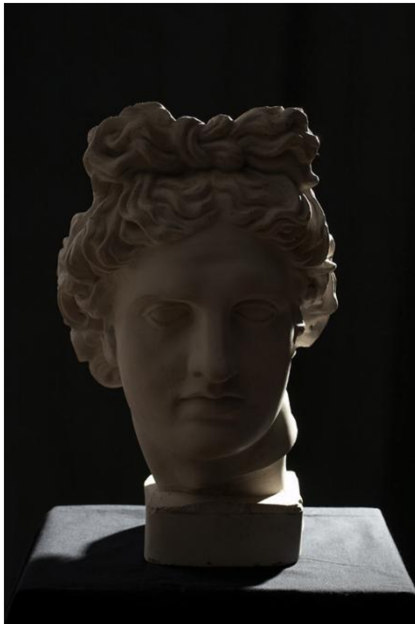
Контровой источник света.