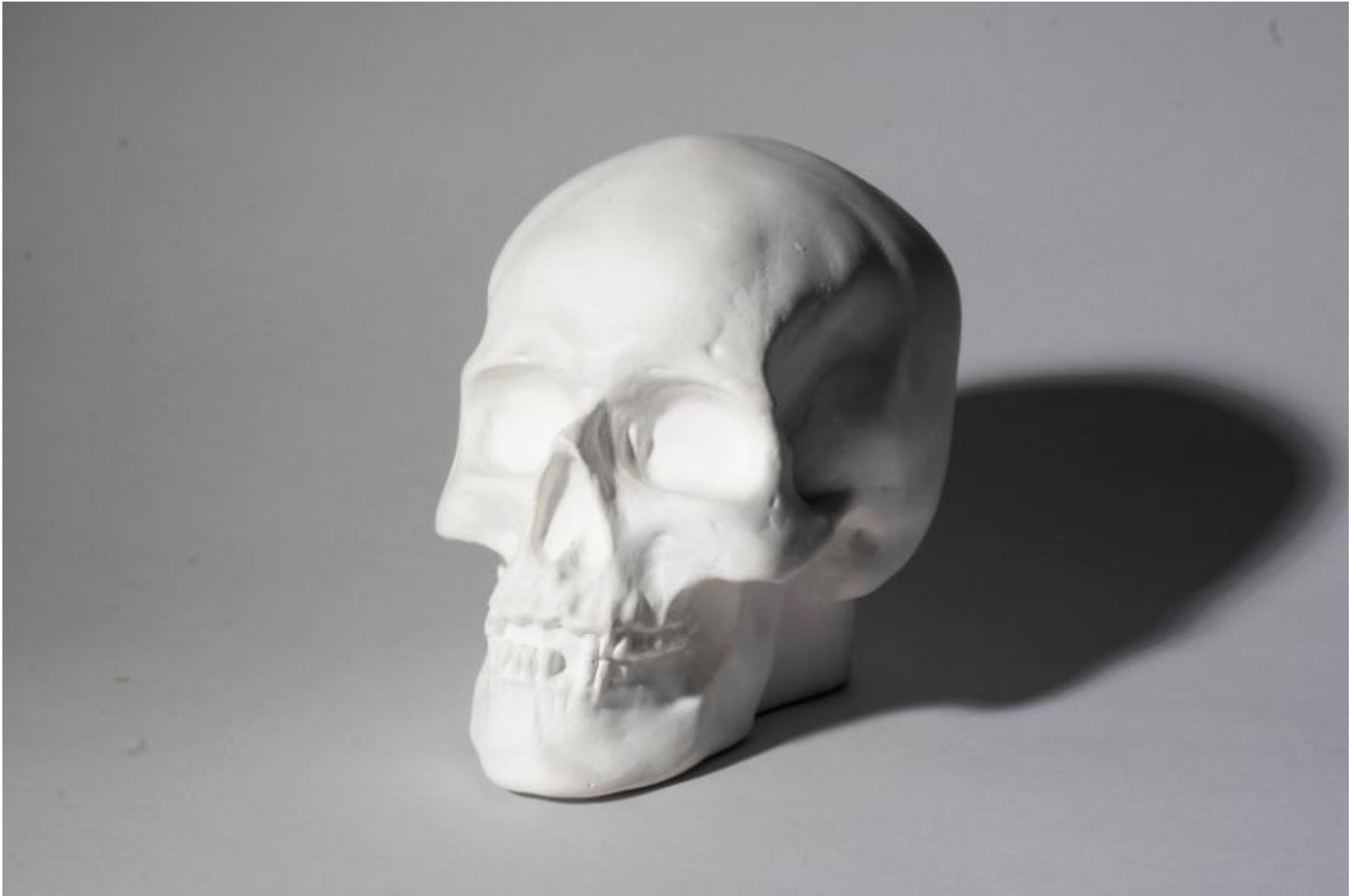
Передне-боковое освещение (45 °); пример жесткого освещения.