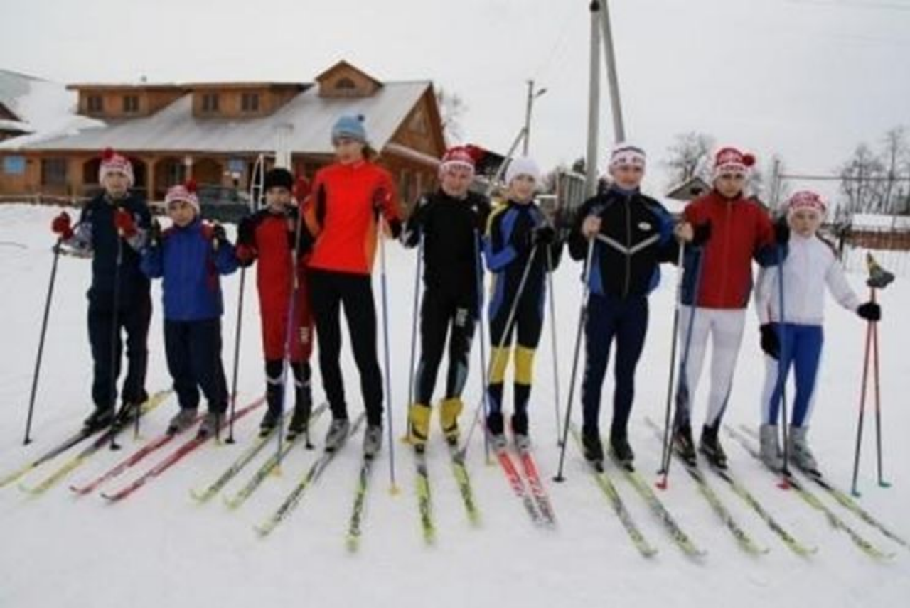
Команда в сборе.