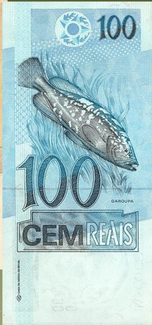
попугай ара, когтистая обезьяна, пума и рыба гарупа.