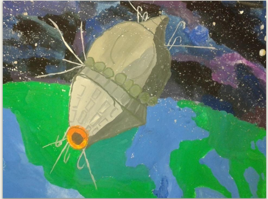
"Восток-1" нарисована в 2016 году