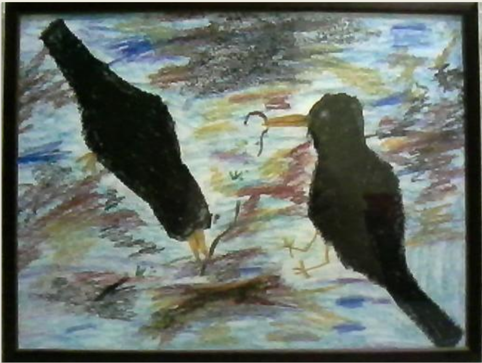
"Грачи" – рисунок выполнен пастелью.