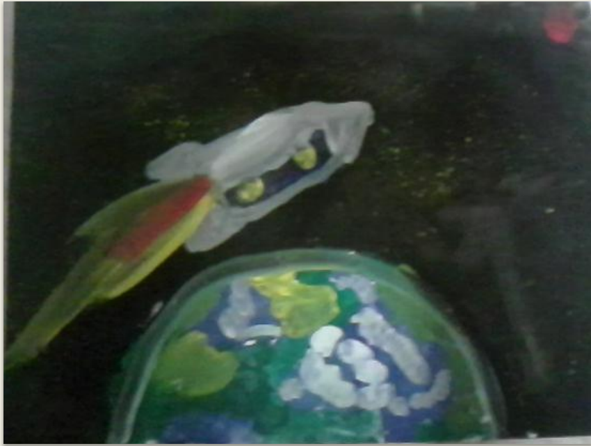
"Ракета над Землёй" нарисована в 2013 году