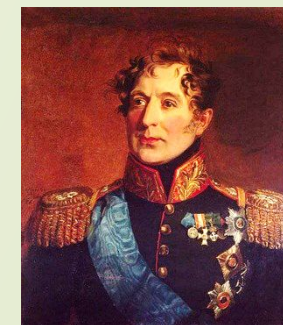
Портрет Михаила Андреевича Милорадовича работы Джорджа Доу. Военная галерея Зимнего Дворца, Государственный Эрмитаж (Санкт-Петербург)

В революцию орденом награждали солдат, которые в бою выполняли обязанности офицеров. Потом орден упразднили, но до 1920 года им награждали солдат белой армии, отличившихся в боях