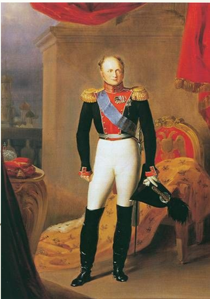
Портрет Александра I, учредившего знак отличия Военного ордена святого великомученика и победоносца Георгия. 1835 г. Художник В.А. Голике.