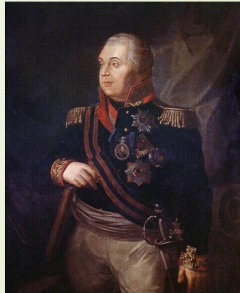
Кутузов Михаил Илларионович

Командовал всей русской армией на начальном этапе Отечественной войны 1812 года, после чего был замещён М. И. Кутузовым. В заграничном походе русской армии 1813—1814 годов командовал объединённой русско-прусской армией в составе Богемской армии австрийского фельдмаршала князя Шварценберга