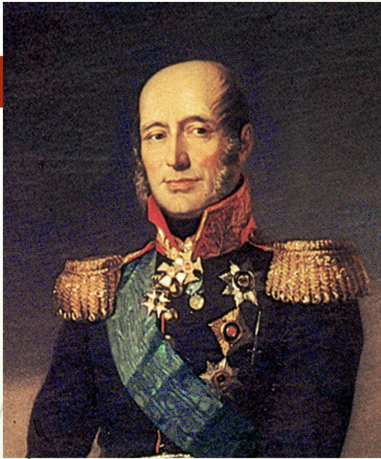
Барклай Де Толли Михаил Богданович

Командовал всей русской армией на начальном этапе Отечественной войны 1812 года, после чего был замещён М. И. Кутузовым. В заграничном походе русской армии 1813—1814 годов командовал объединённой русско-прусской армией в составе Богемской армии австрийского фельдмаршала князя Шварценберга