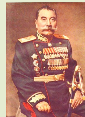
Семён Михайлович Будённый Советский военачальник, один из первых маршалов Советского Союза. Трижды Герой Советского Союза, кавалер восьми орденов Ленина, полный кавалер Георгиевского креста и Георгиевской медали всех степеней.