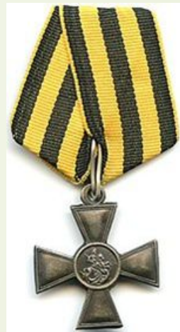
Георгиевский крест и солдатский «Егорий»

Причисленная к ордену Святого Георгия награда в Русской императорской армии для нижних чинов с 1807 по 1917 годы. До 1913 года имел неофициальное название Геóргиевский крест