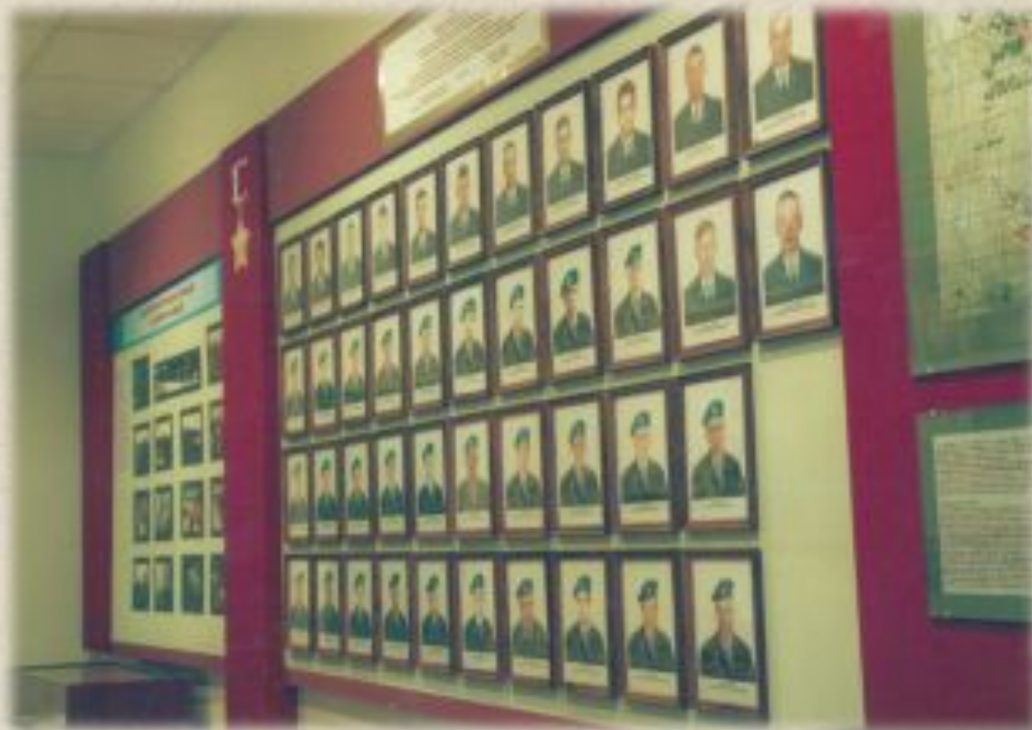
Комната Боевой славы 6-й роты в городе Псков

В бою под Улус-Кертом погибли представители 47 республик, краёв и областей России. Все герои ушли в сражение из Пскова, где дислоцирована прославленная 76-я гвардейская десантно-штурмовая дивизия.