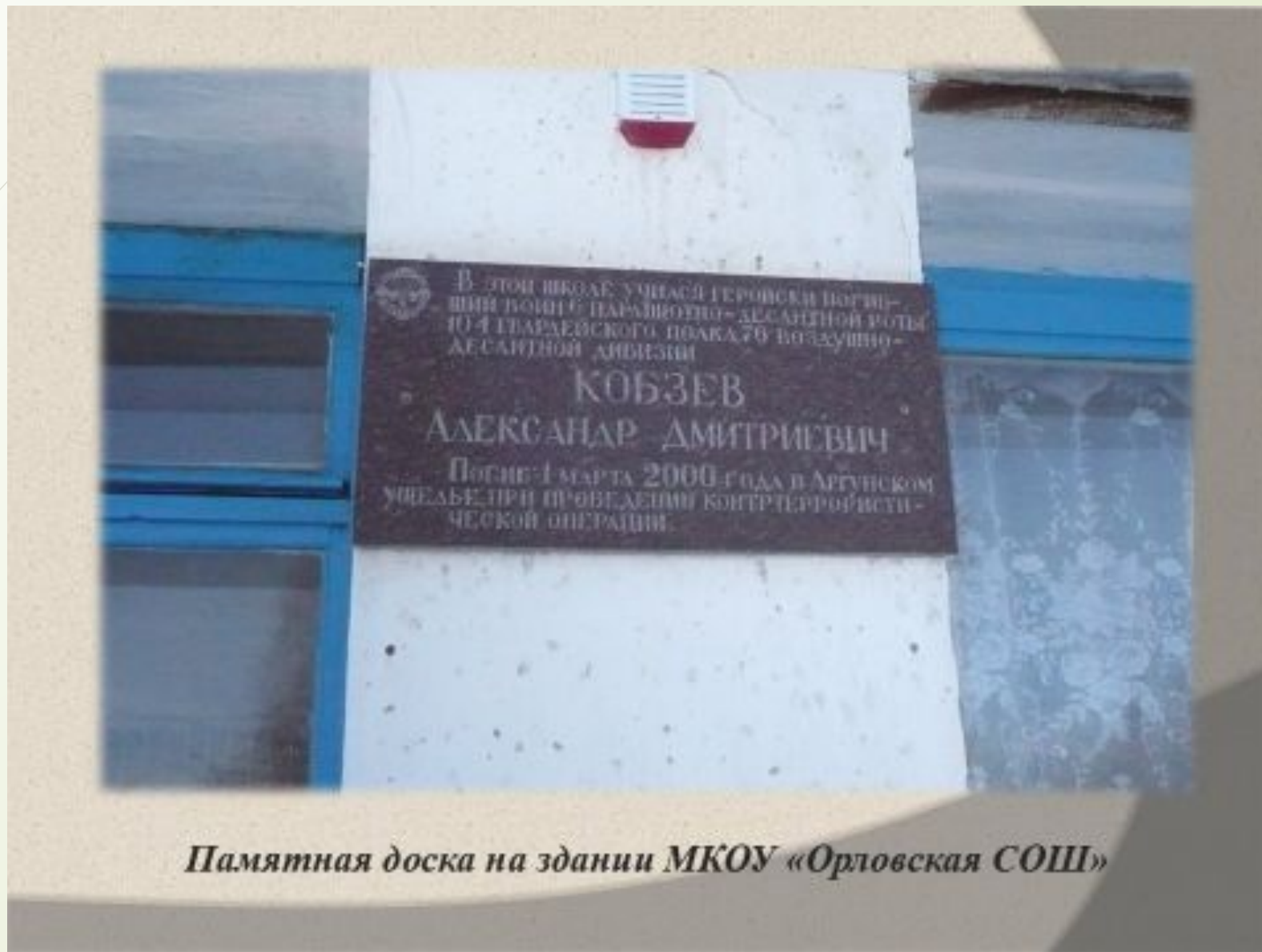
Памятная доска на здании МКОУ «Орловская СОШ»