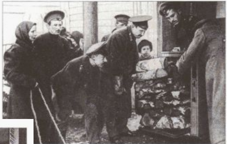
Продажа дров на вес. 1916 г. Почему в такой богатой лесом стране как Россия, дрова продавали на вес?