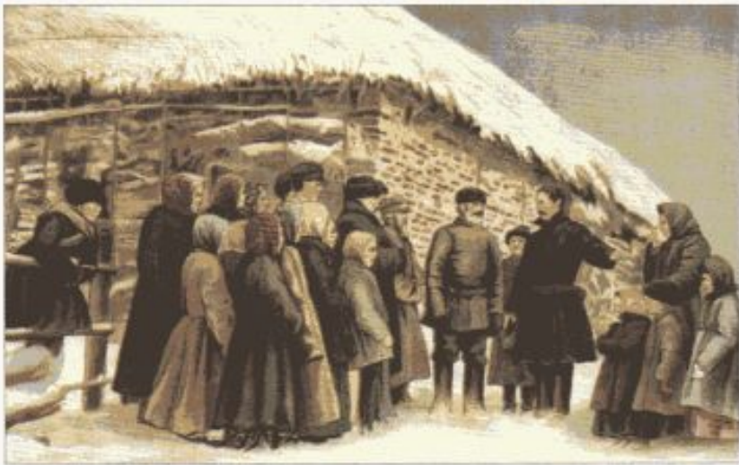
Мобилизация в деревне. Прощание с односельчанами: «Не забудьте, соседи, моих жену и деток». Плакат начала XX в.