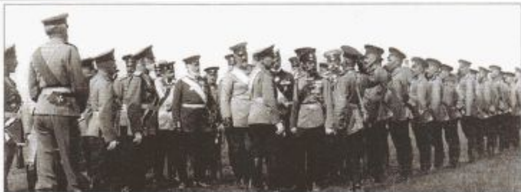
Российский и германский императоры Николай II и Вильгельм II беседуют с солдатами русского пехотного полка. 1912 г.