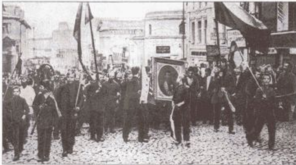
Патриотическая демонстрация. Август 1914 г.