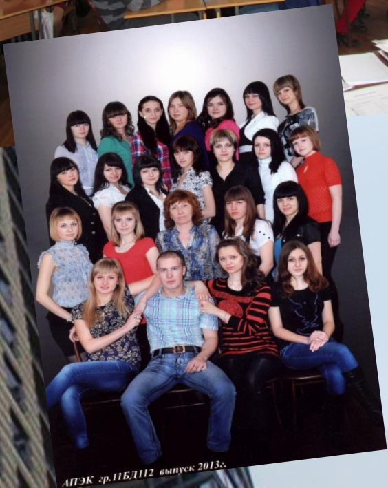
АПЭК г.п.БДН2 выпуск 2013г.