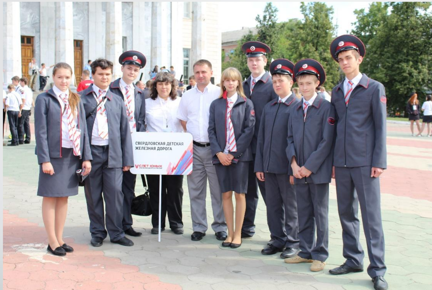
Команда Свердловской детской железной дороги на V слёте юных железнодорожников. 25 июля 2014 года г. Казань