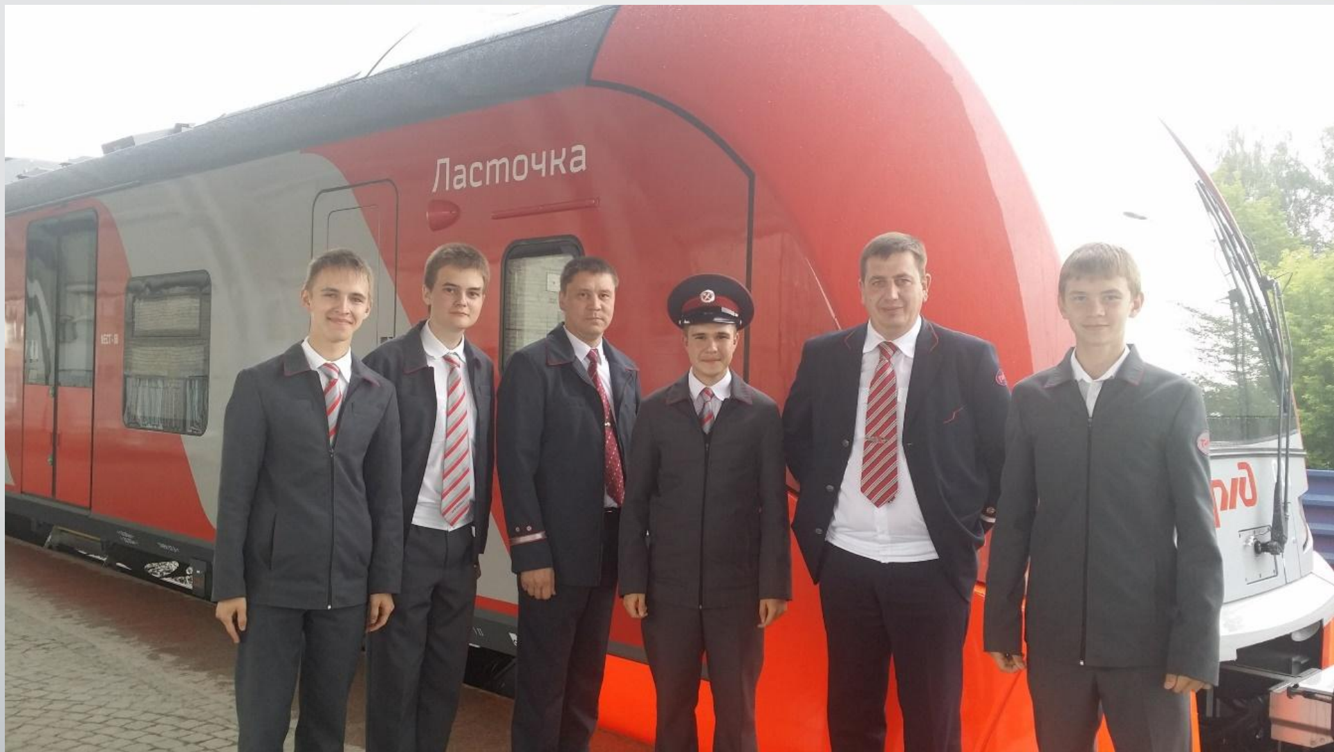
С локомотивной бригадой ЭС2Г на ст. «Аэропорт Кольцово» 9 июля 2015 года.