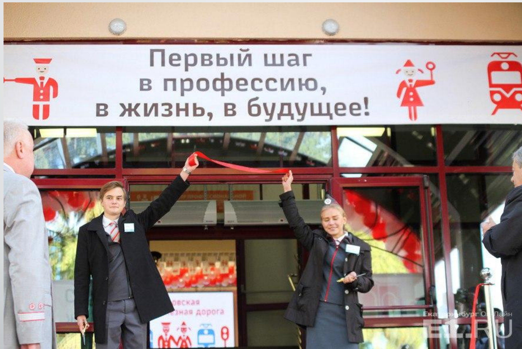
Открытие нового здания вокзала. 13 сентября 2016 года