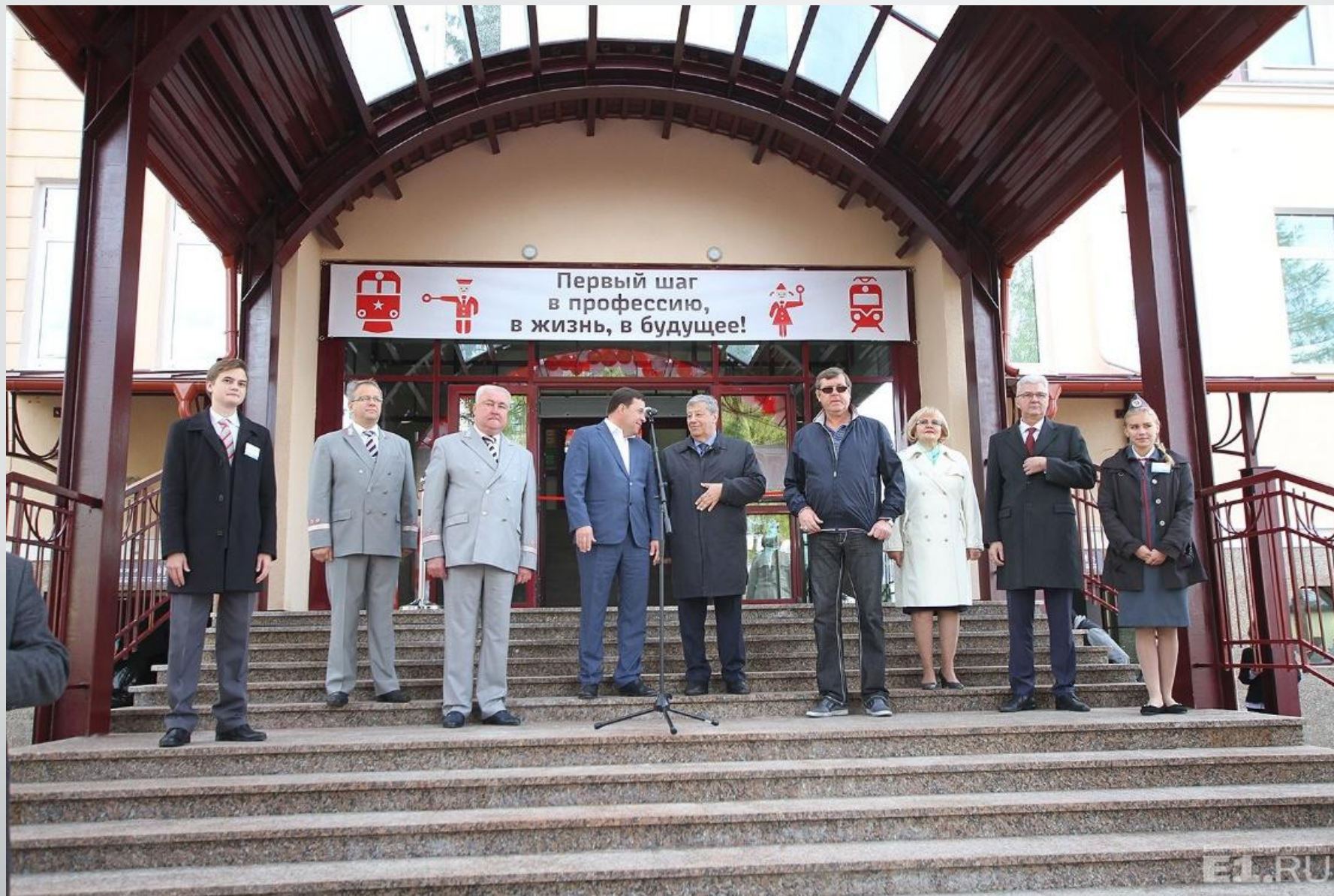
Открытие нового здания вокзала. 13 сентября 2016 года