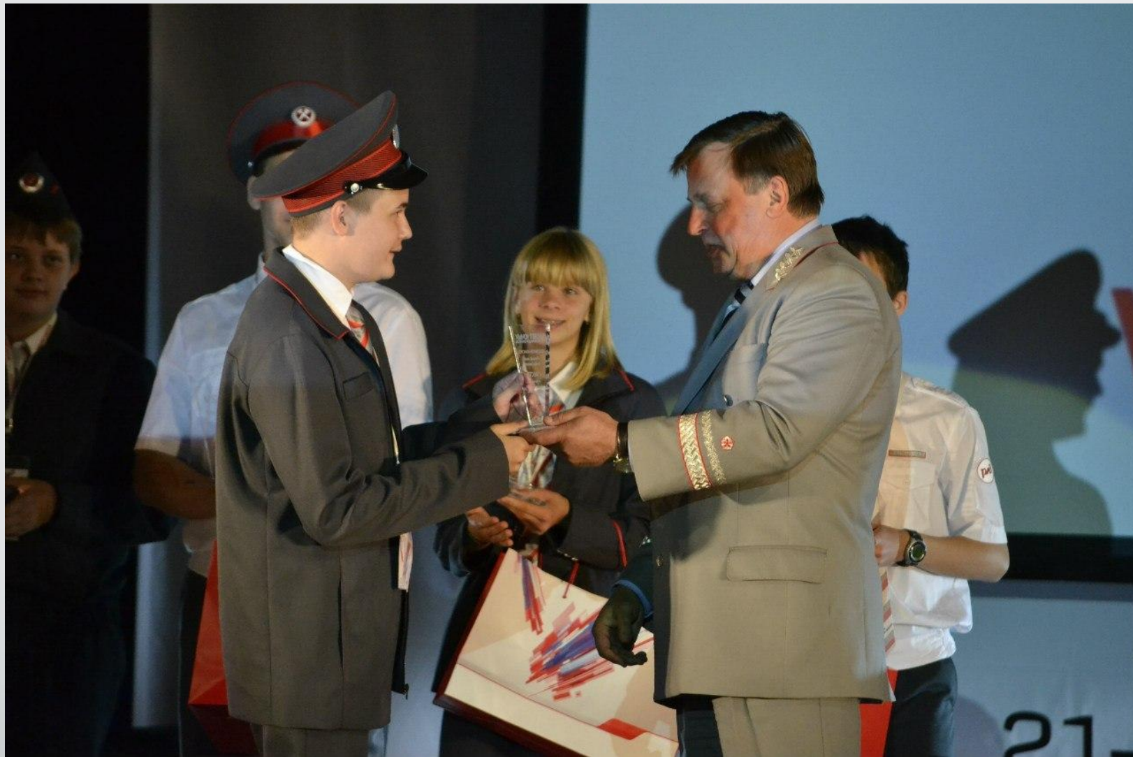
Победитель в номинации «Лучший машинист тепловоза ТУ-7» на V слёте юных железнодорожников. 25 июля 2014 года г.Казань