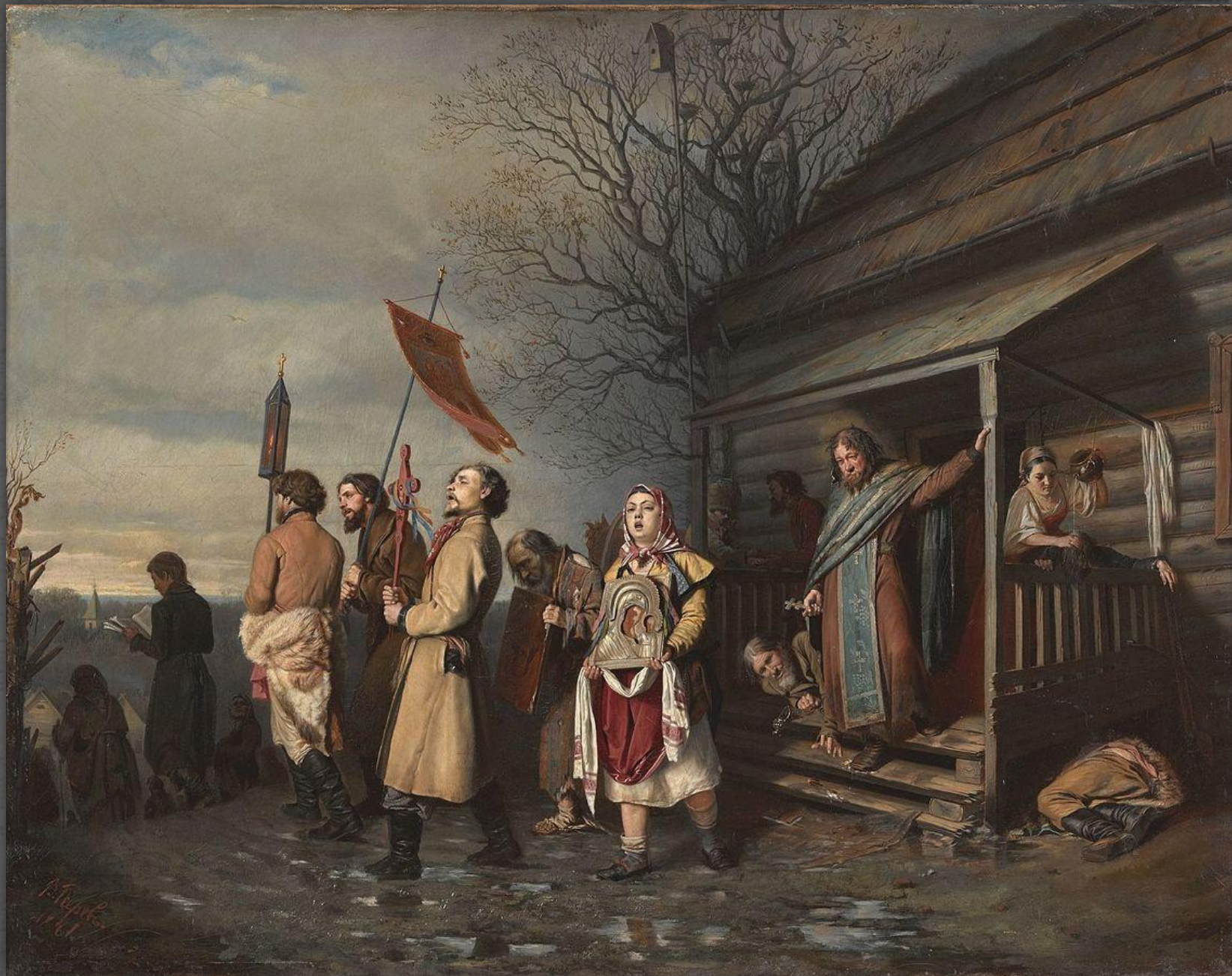
Сельский крестный ход на Пасхе. ТГ. 1861 г.