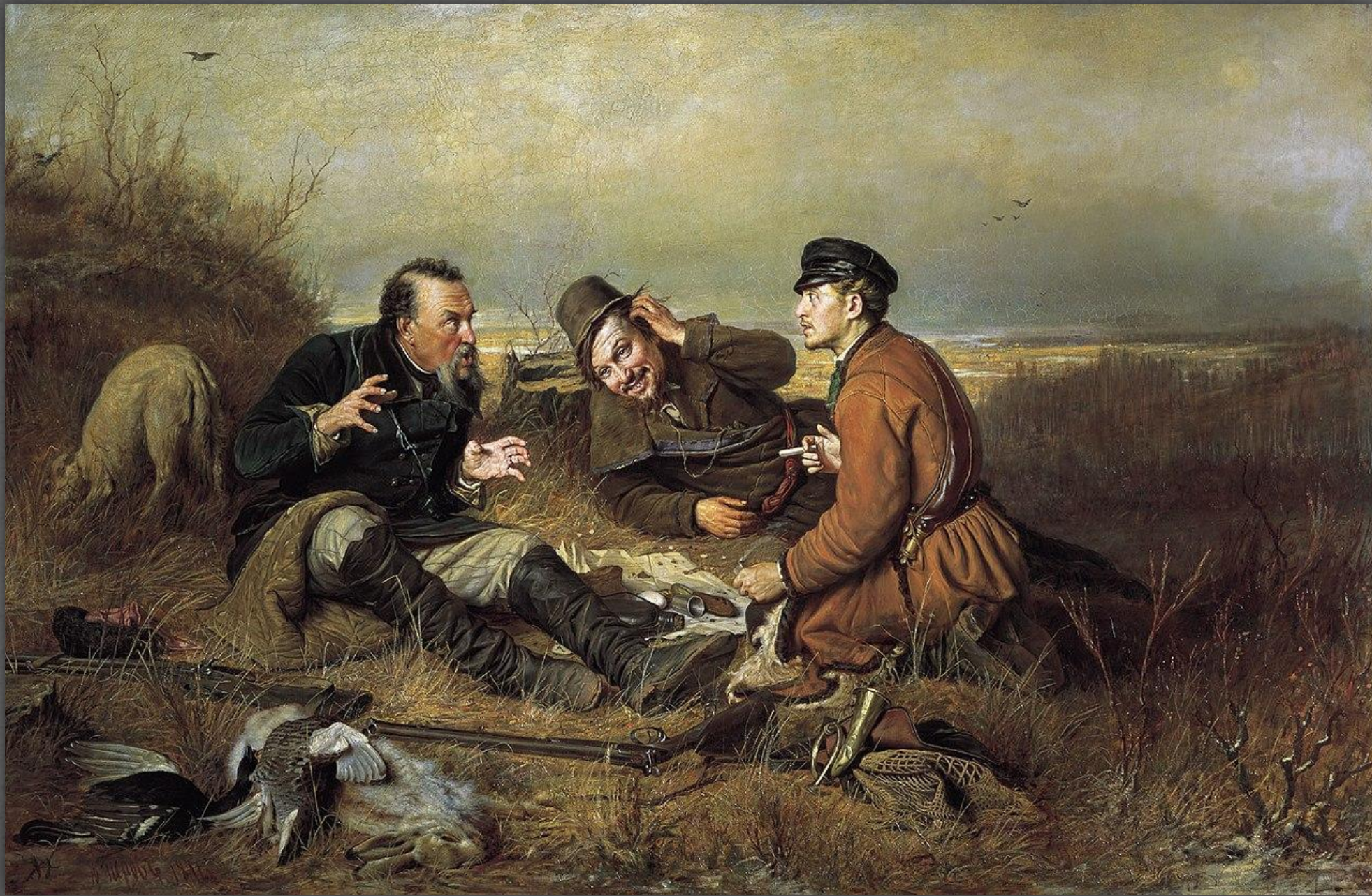
Охотники на привале. ТГ. 1871 г.