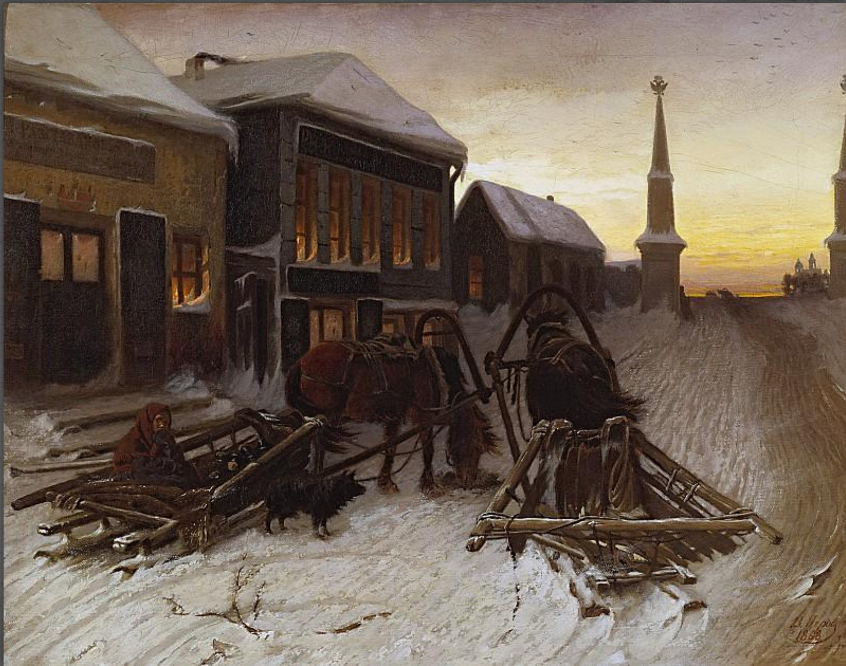
Последний кабаk у заставы. ТГ. 1868 г.