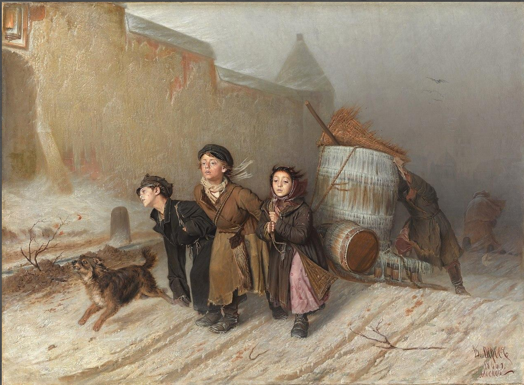
Тройка. Ученики- мастеровые везут воду. ТГ. 1866 г.