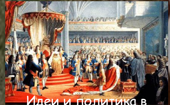
Идеи и политика в Европе в XVIII веке