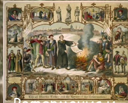
Реформация и абсолютизм