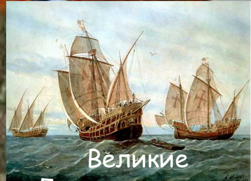
Великие Географические открытия