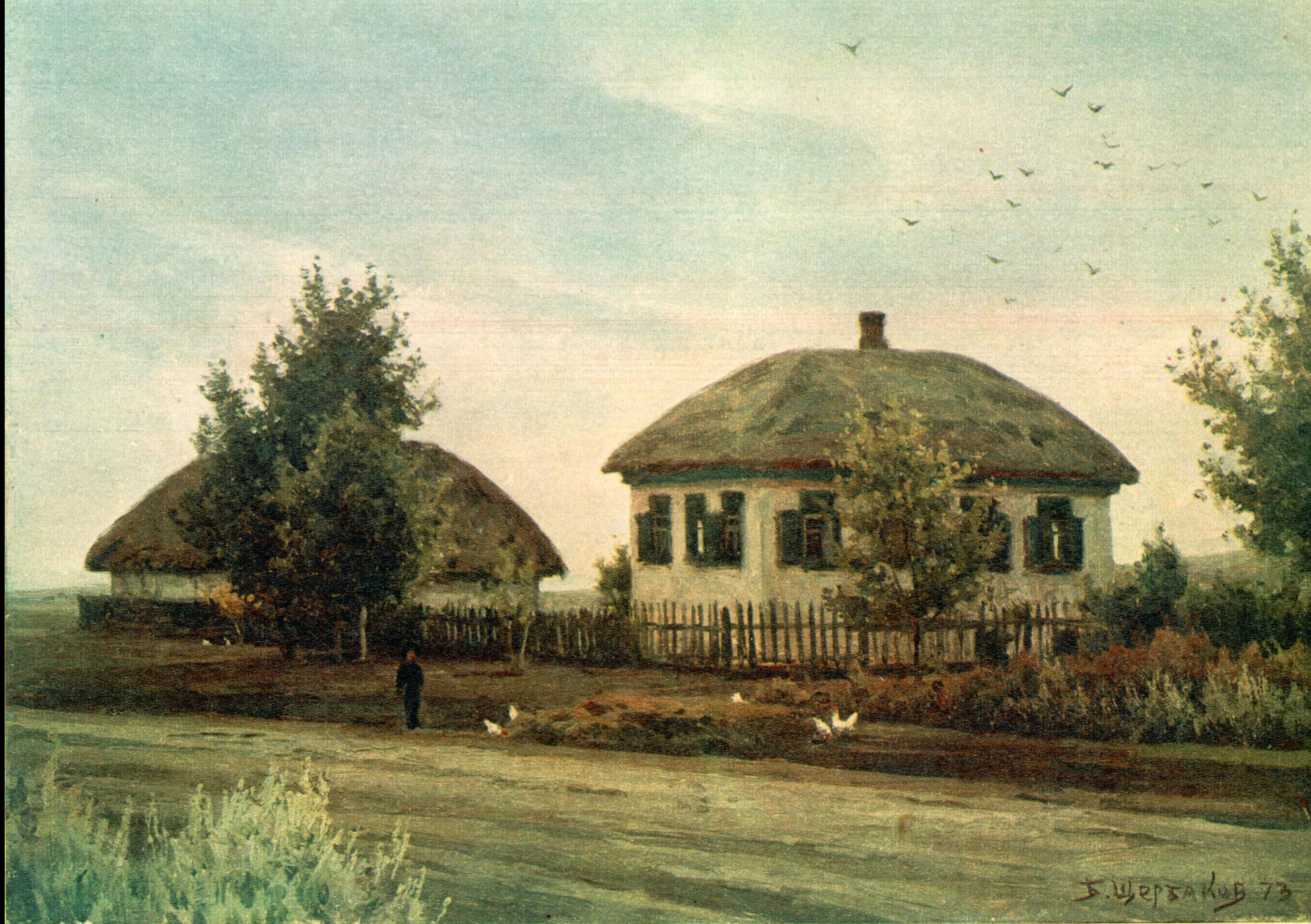
Б. Щербаков. ДОМ, ГДЕ РОДИЛСЯ ШОЛОХОВ (ХУТОР КРУЖИЛИНСКИЙ).