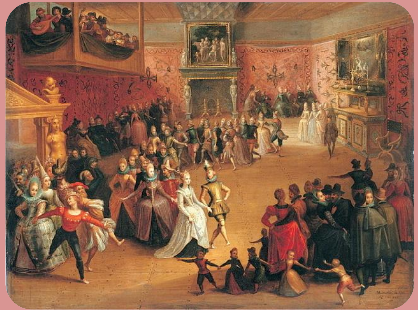
Pinx: St. Rejchan.