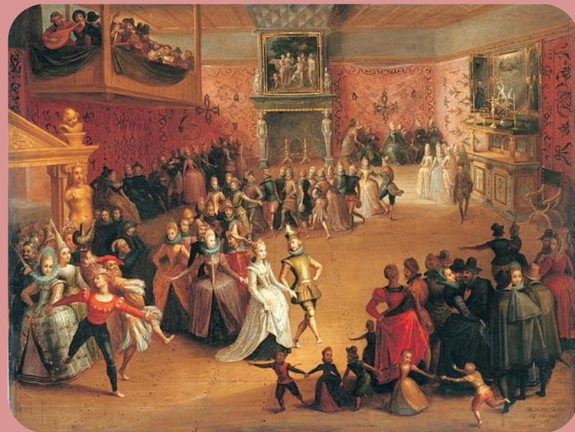
Pinx: St. Rejchan.