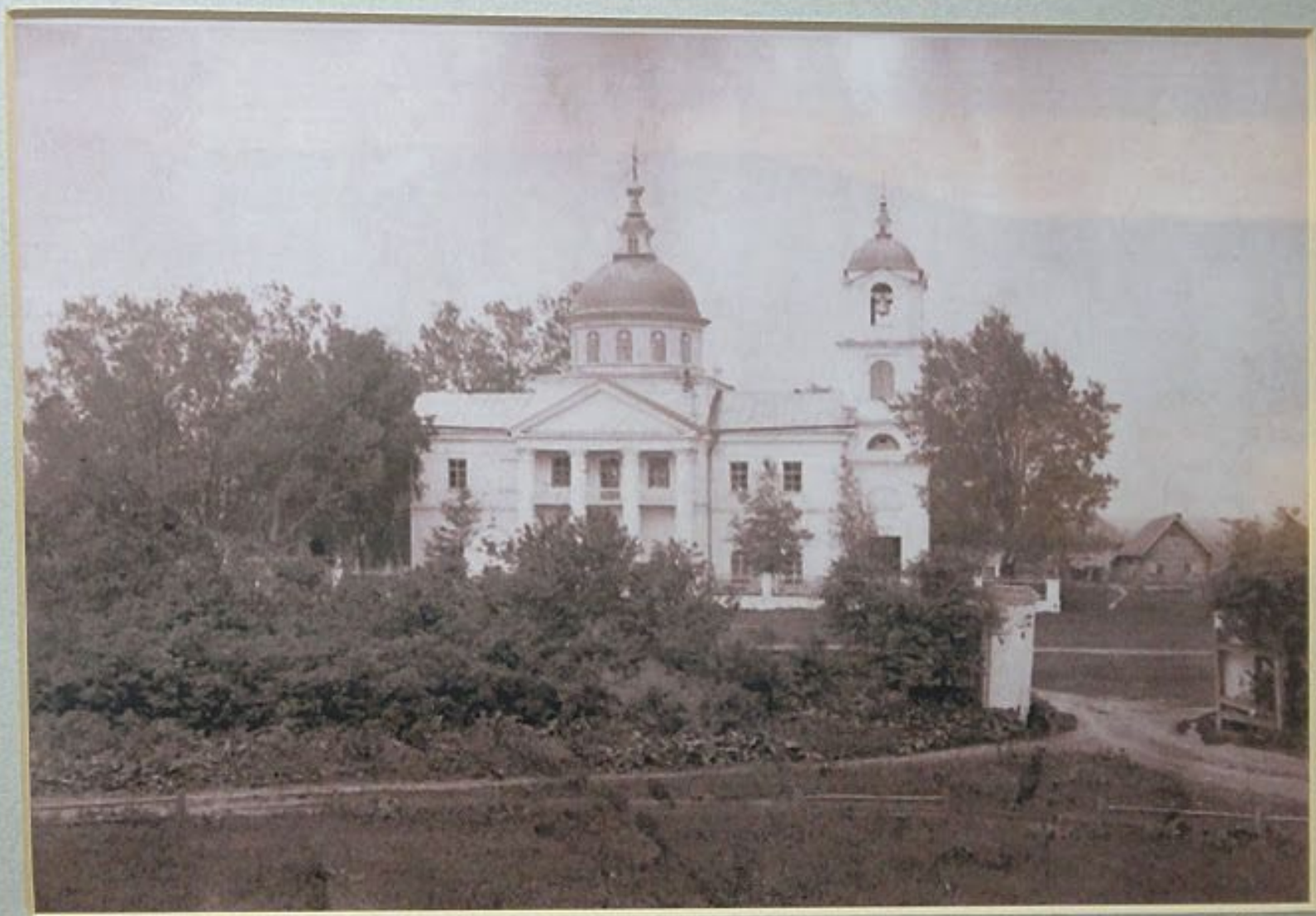
Церковь в с. Юматово