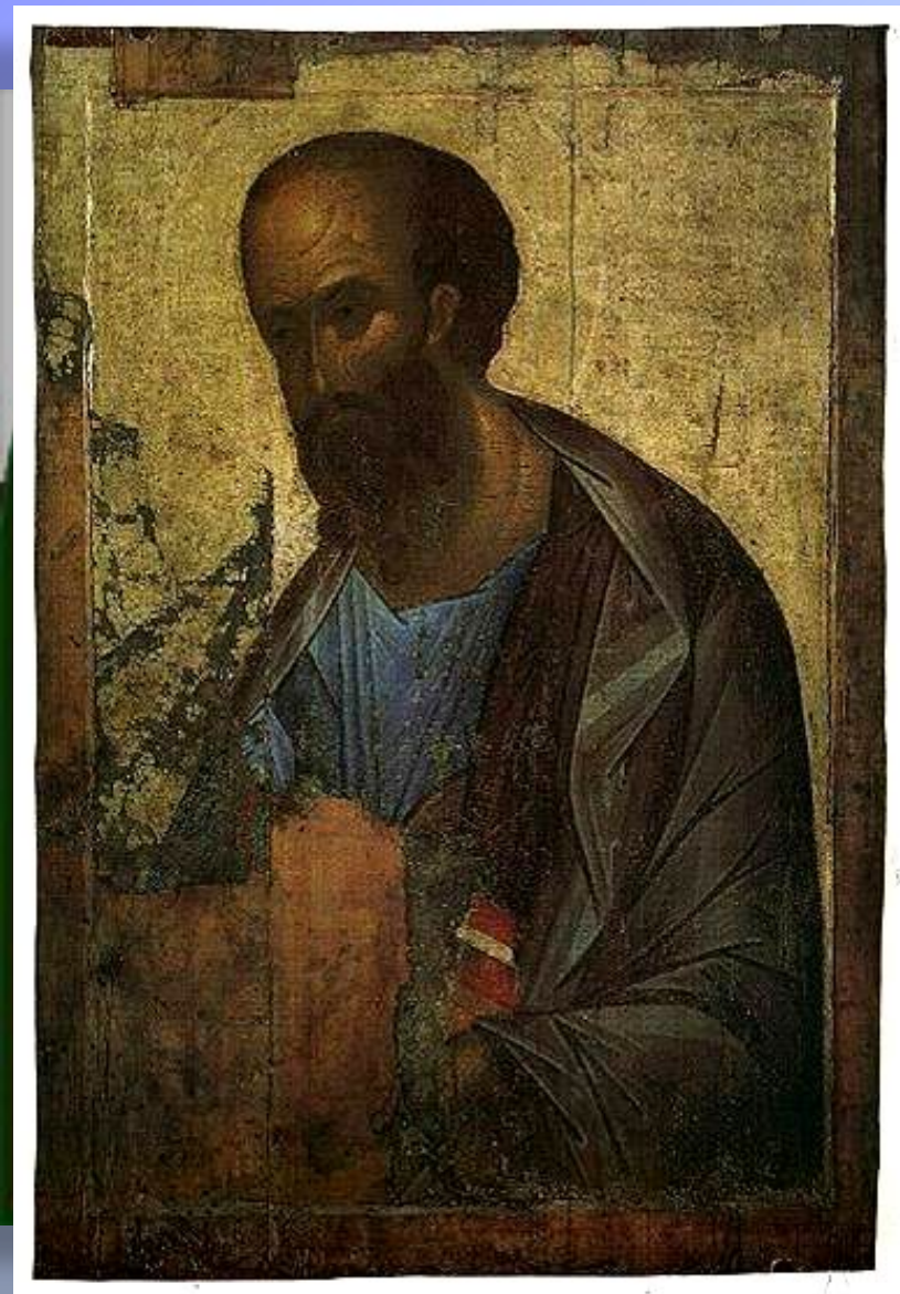
АПОСТОЛ ПАВЕЛ Правая икона деисусного Звенигородского чина.

Желая приблизить к земле рай, наши предки старались окружить себя иконами.