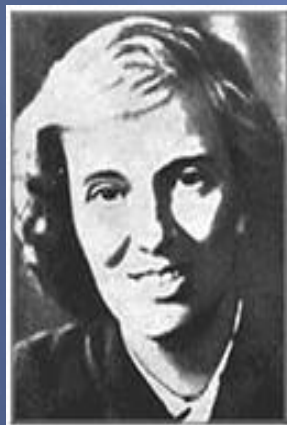
Д. Кроуфут- Ходжкин