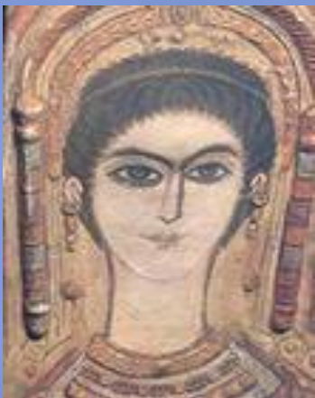
Главный химик Месопотамии Таппути