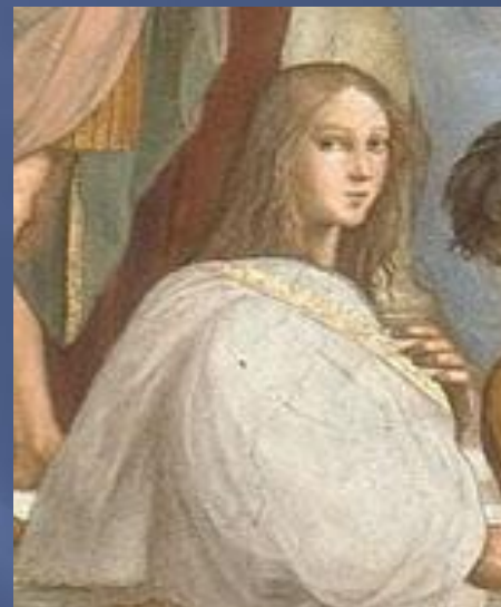
Гинатия (Нуратия, Ипатия из Александрии, род. 370 — ум. 415)