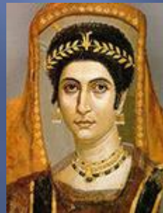
Великий алхимик Мириам