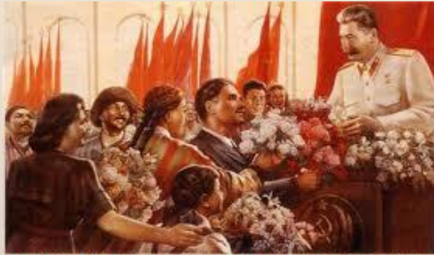
ВЕЛИКИЙ СТАЛИН-ЗНАМЯ ДРУЖБЫ НАРОДОВ СССР!