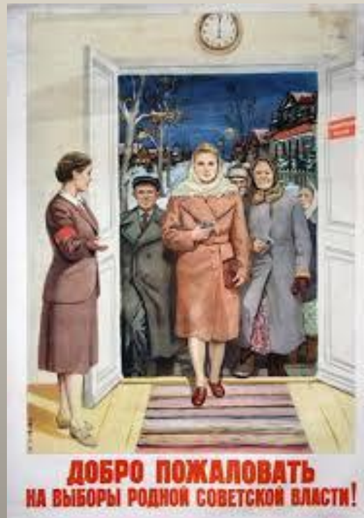
ДОБРО ПОЖАЛОВАТЬ НА ВЫБОРЫ РОДНОЙ СОВЕТСКОЙ ВЛАСТИ!

Трудящиеся Советского Союза! 10 февраля 1946 года — день выборов в Верховный Совет СССР. ВЫБЕРЕМ в депутаты Верховного Совета СССР ЛУЧШИХ СЫНОВ и ДОЧЕРЕЙ НАШЕГО НАРОДА! ОЗНАМЕНУЕМ выборы новыми трудовыми победами! Конституция СССР не просто провозглашает демократические свободы, но и обеспечивает их в законодательном порядке известными материальными средствами.