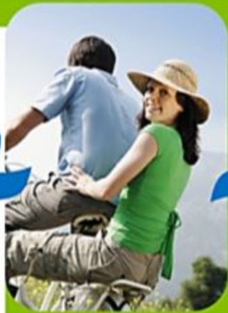
Активный образ жизни