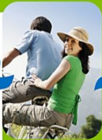
Активный образ жизни