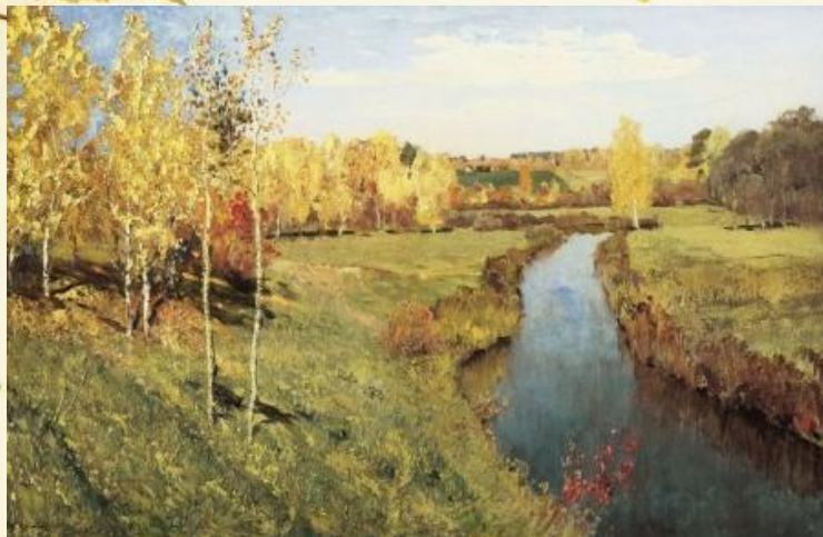
Исаак Левитан «Золотая осень»