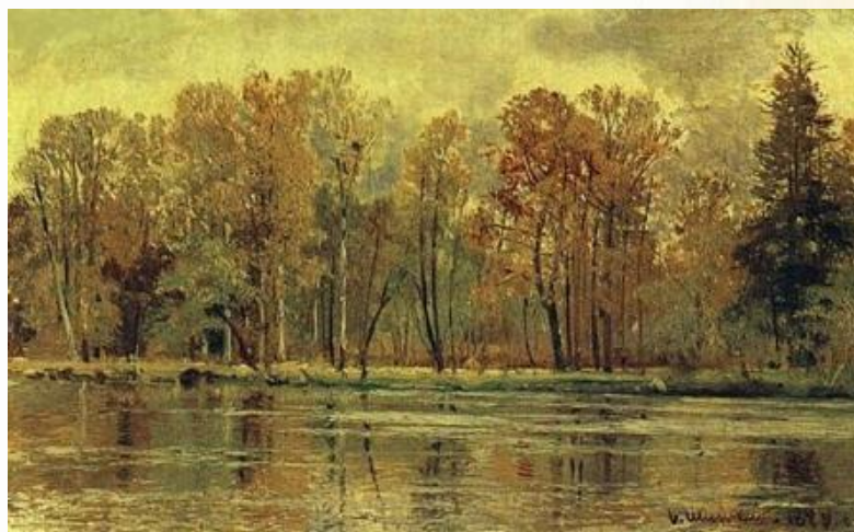
Иван Шишкин «Золотая Осень»