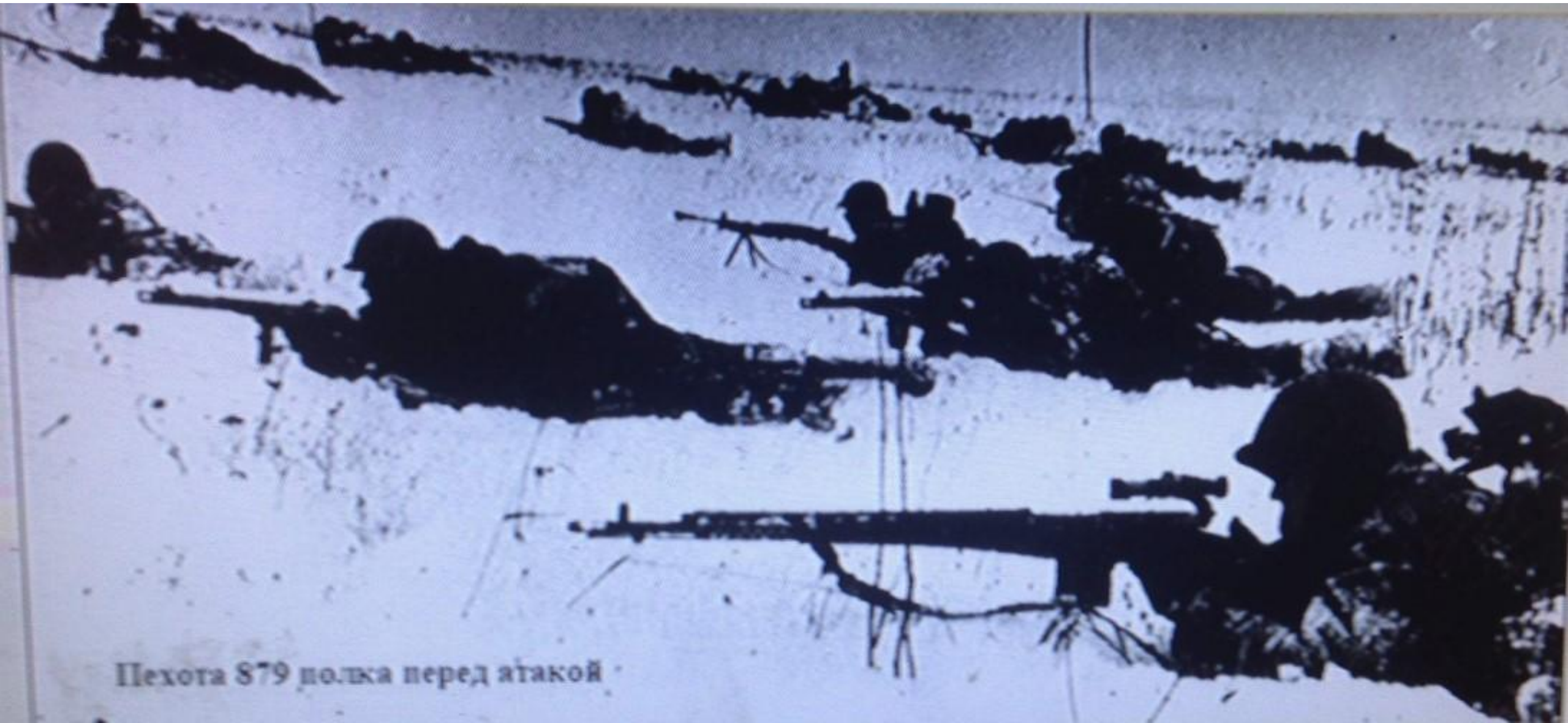
Пехота 879 полка перед атакой