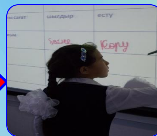
Ақт мүмкіндіктерін пайдалану

Бағдарлама модульдерін сабақта барысында қолдану