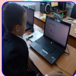
Күрделенген тапсырма ТЖДБО