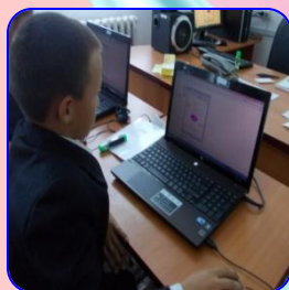
Күрделенген тапсырма ТЖДБО