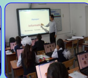
Ақт мүмкіндіктерін пайдалану