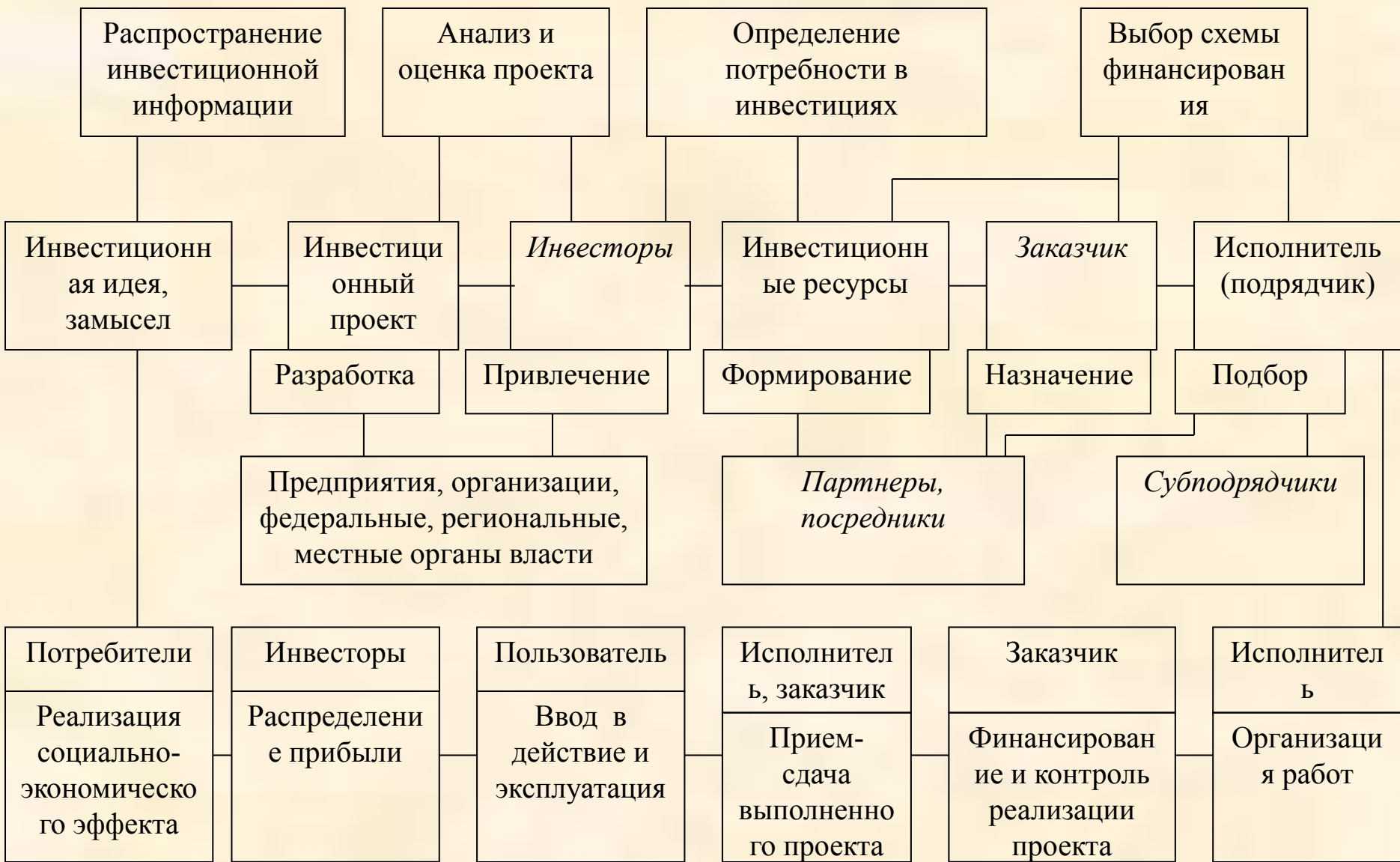
Схема инвестиционного проекта