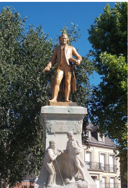
Памятники Антуану Пармантье во Франции

Антуан Пармантье — человек, который отдал свою жизнь упорной борьбе за распространение картофеля во Франции.