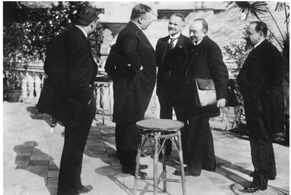
Представители советской и немецкой сторон в Рапалло