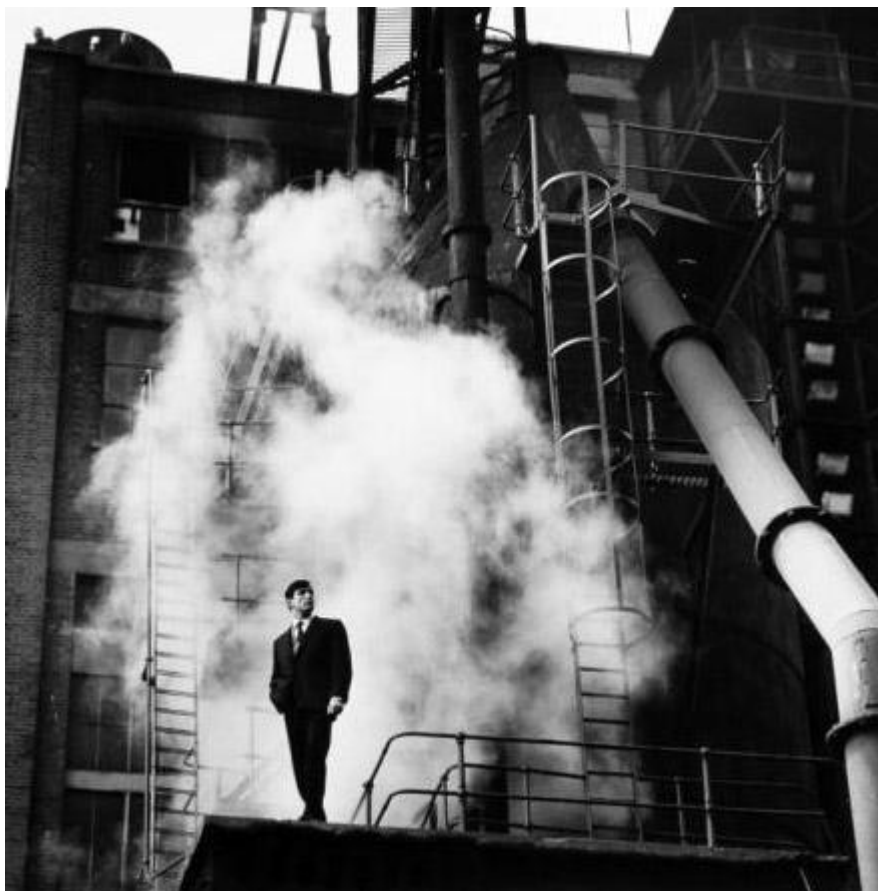
Теренс Донован (Terence Donovan)