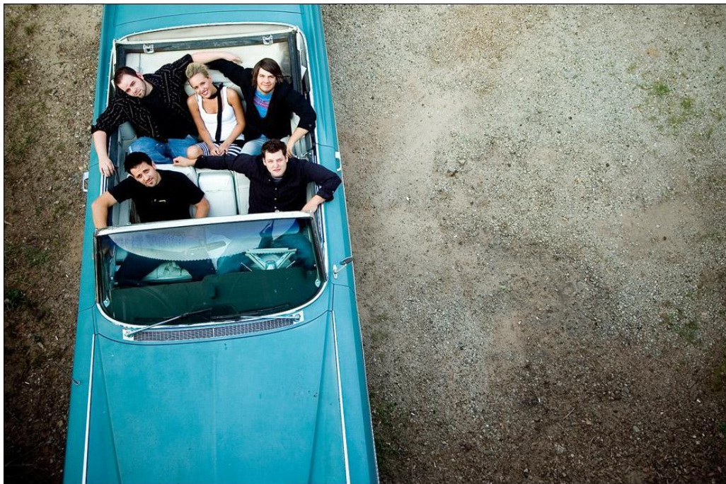
Зак Эйрис (Zack Arias)