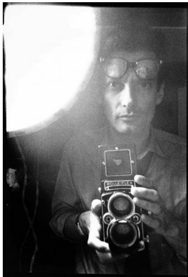
Ричард Аведон (Richard Avedon)