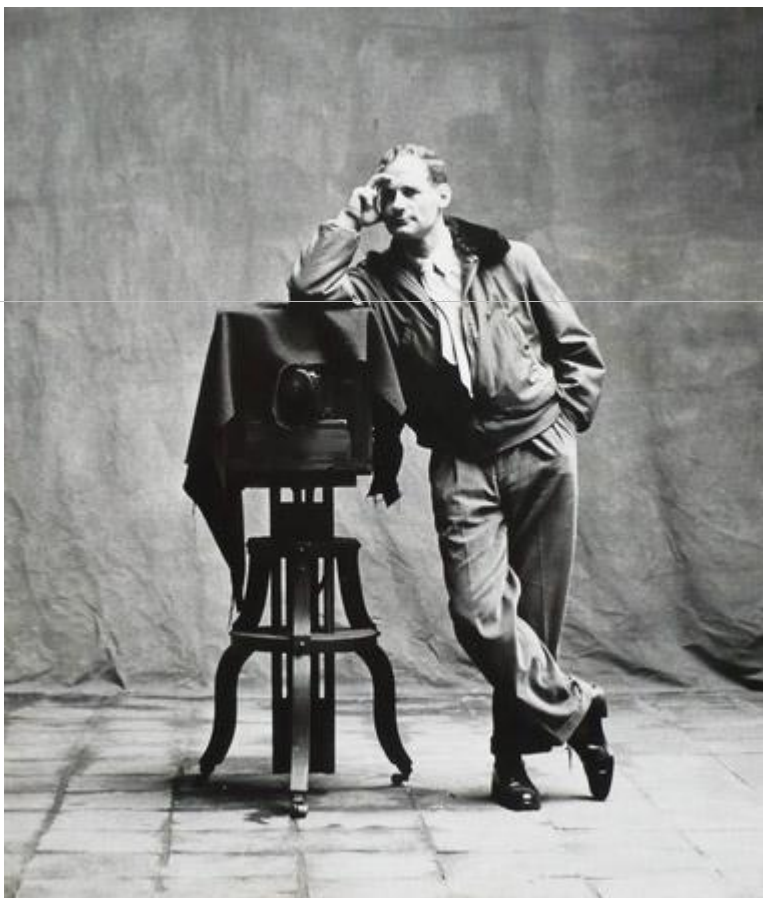
Ирвинг Пенн (Irving Penn)