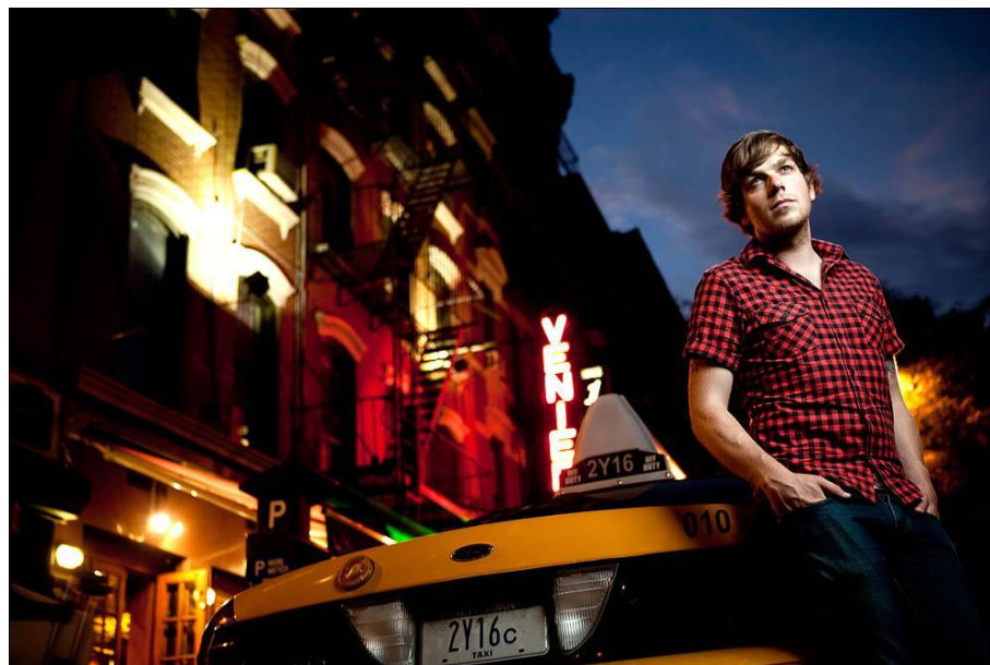
Зак Эйрис (Zack Arias)