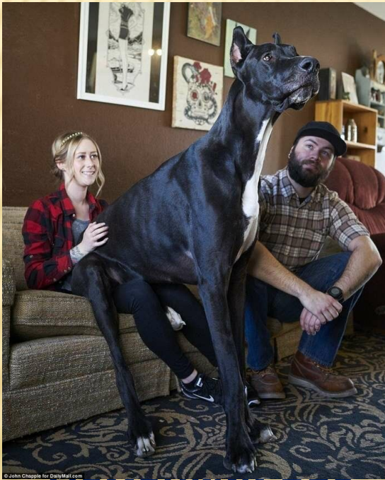
□ □ немецкий дог