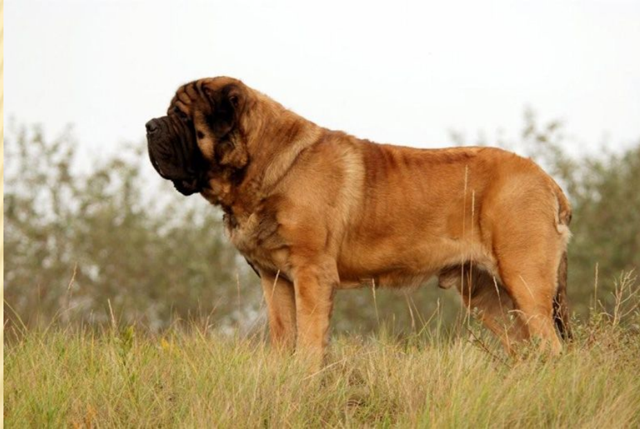
▣ Английский мастиф

Самая тяжёлая собака весит 155 кг, а самая лёгкая-283 г.