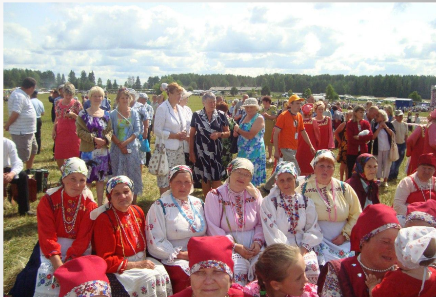
Ансамбль «Дзоридз кытшын»