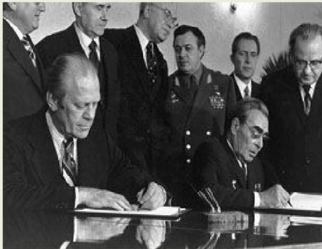
Л.И. Брежнев и Дж. Форд Владивосток, 1974г.