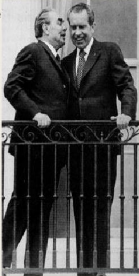
Л.И. Брежнев и Р. Никсон Москва, май 1972г.