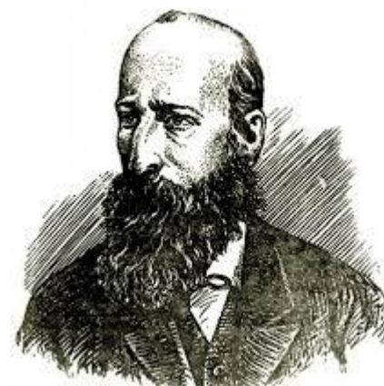
АФАНАСЬЕВ АЛЕКСАНДР НИКОЛАЕВИЧ ( 1826 - 1871 )