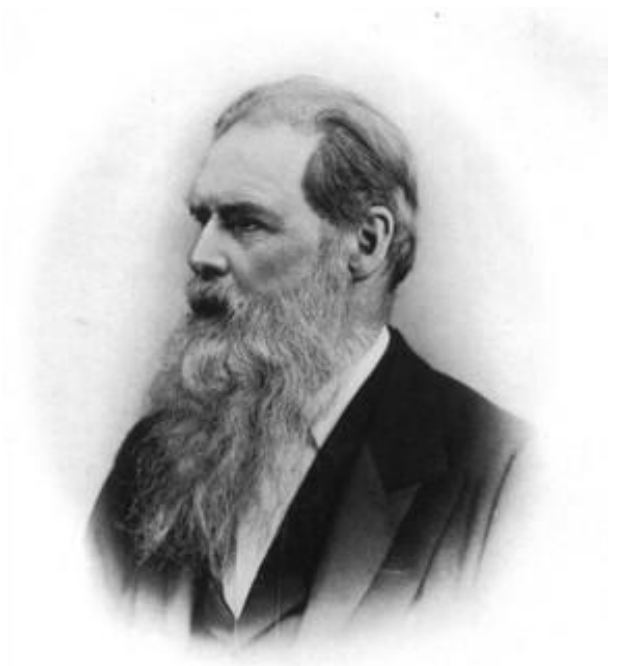
E.B. Tylor Act. 67