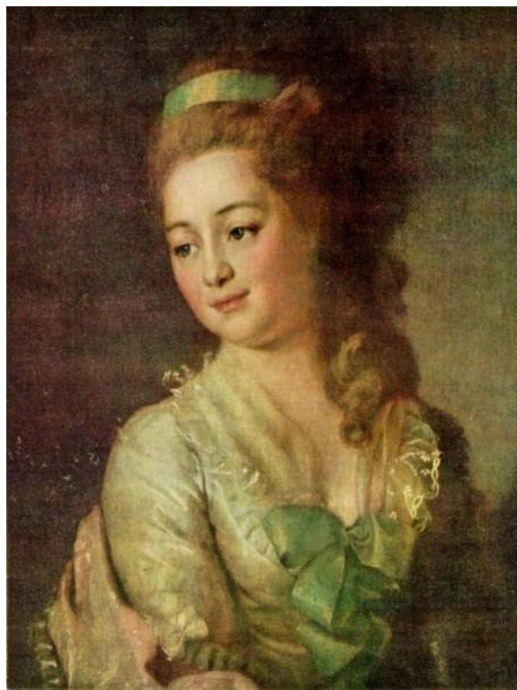
Д.Г. ЛЕВИЦКИЙ "М.А. ДЬЯКОВА"