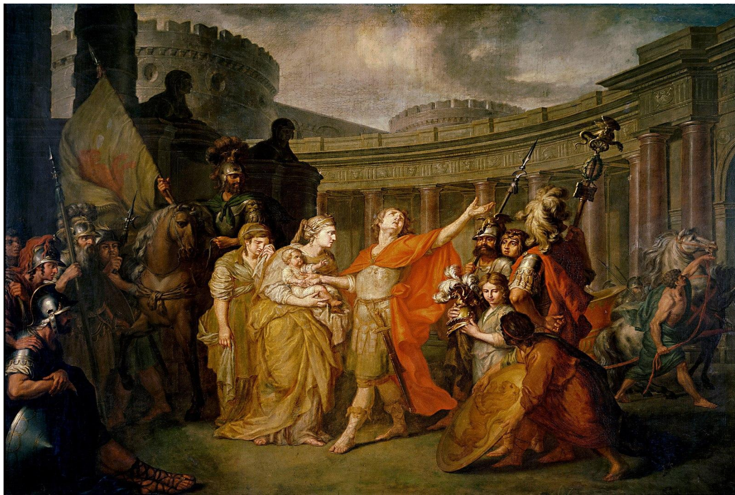
"ПРОЩАНИЕ ГЕКТОРА С АНДРОМАХОЙ"