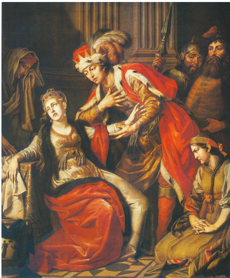
"ВЛАДИМИР И РОГНЕДА"