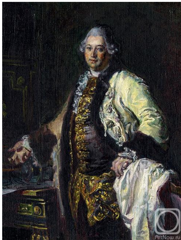
Д.Г. ЛЕВИЦКИЙ "КОКОРИНОВ"