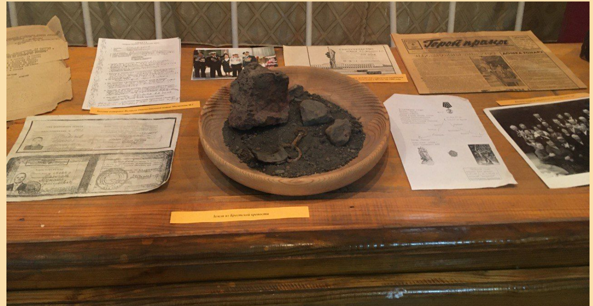
Документы и вещи связанные с жизнью М. Г. Малыгаева