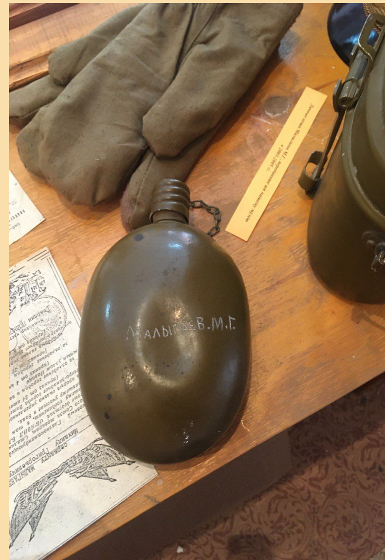
Личные вещи М. Г. Малыгаева военных времён