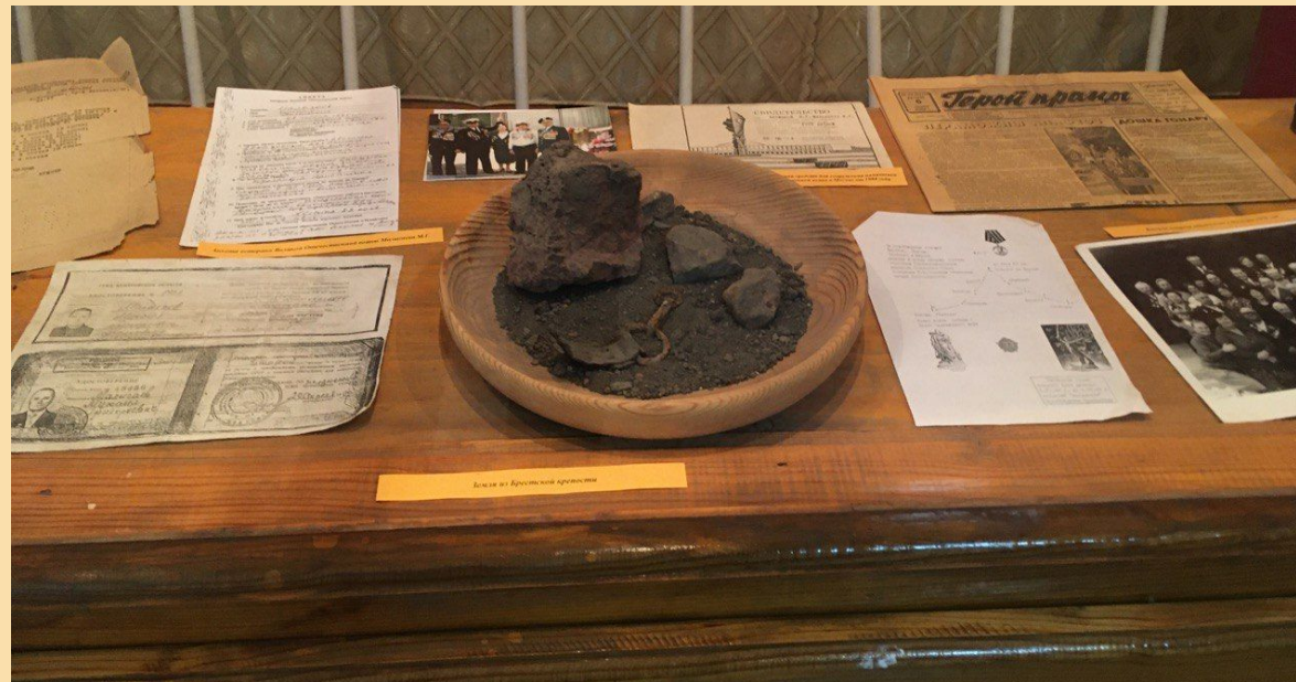
Документы и вещи связанные с жизнью М. Г. Малыгаева