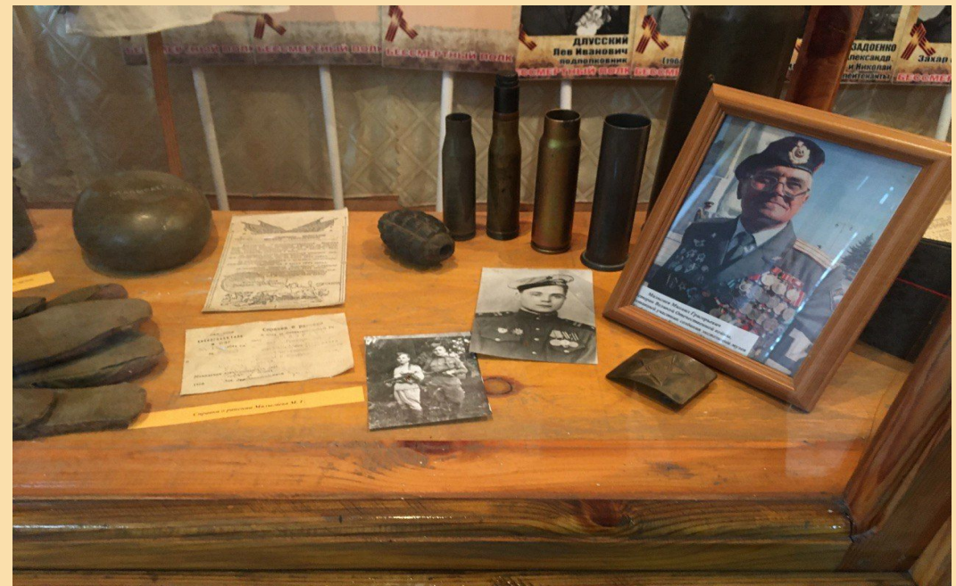
Общий вид выставки