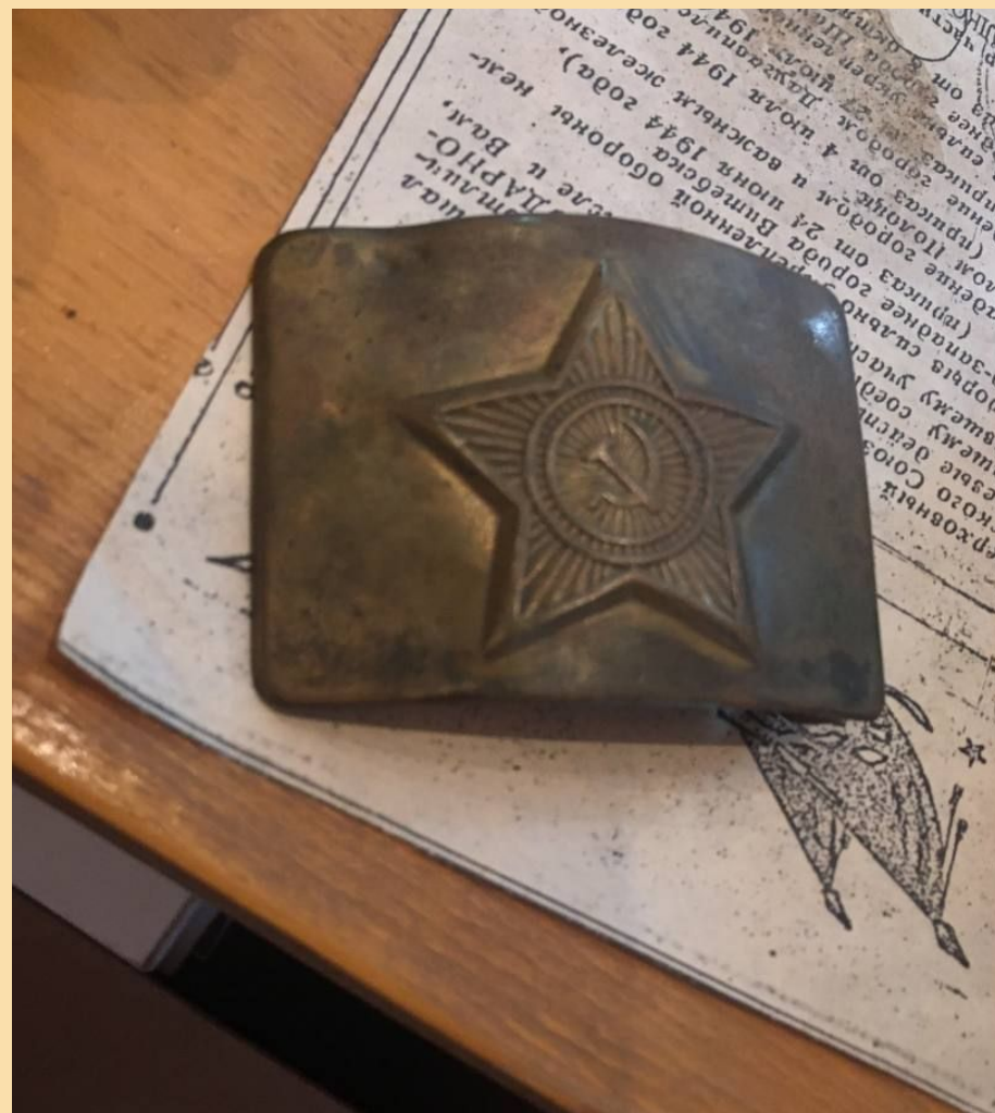
Личные вещи М. Г. Малыгаева военных времён