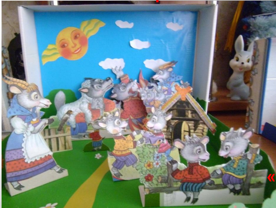
«Волк и семеро козлят»