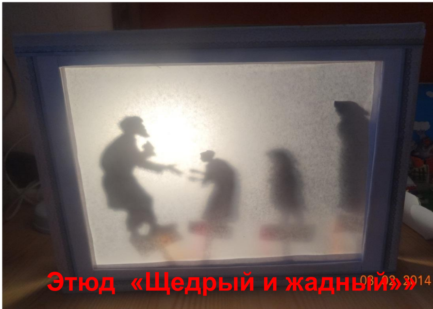
Этюд «Щедрый и жадный»