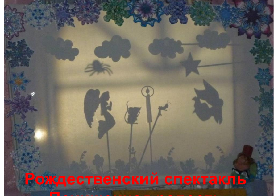
Рождественский спектакль «Похищенная радость»