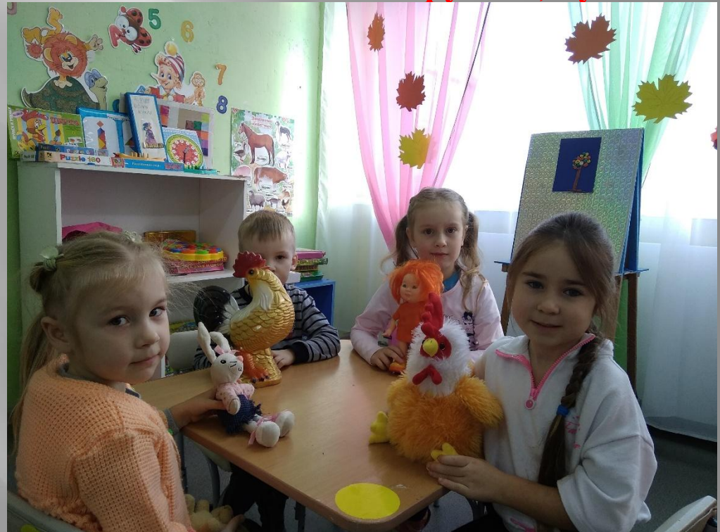
Мягкие игрушки, куклы

Игрушки-самodelки (из ткани, ниток и др.)