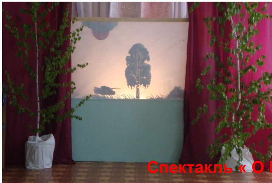
Спектакль « О Великой Победе !»