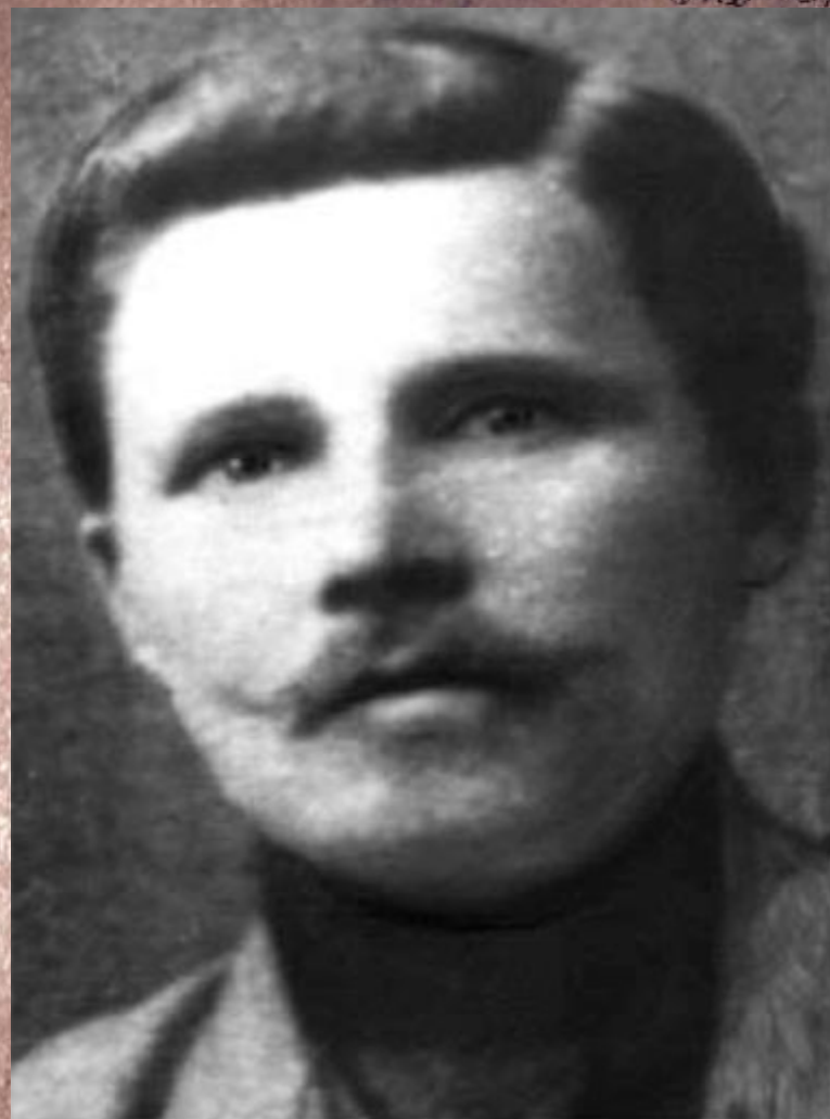
Отец, Трифон Гордеевич Твардовскогий, был деревенским кузнецом.