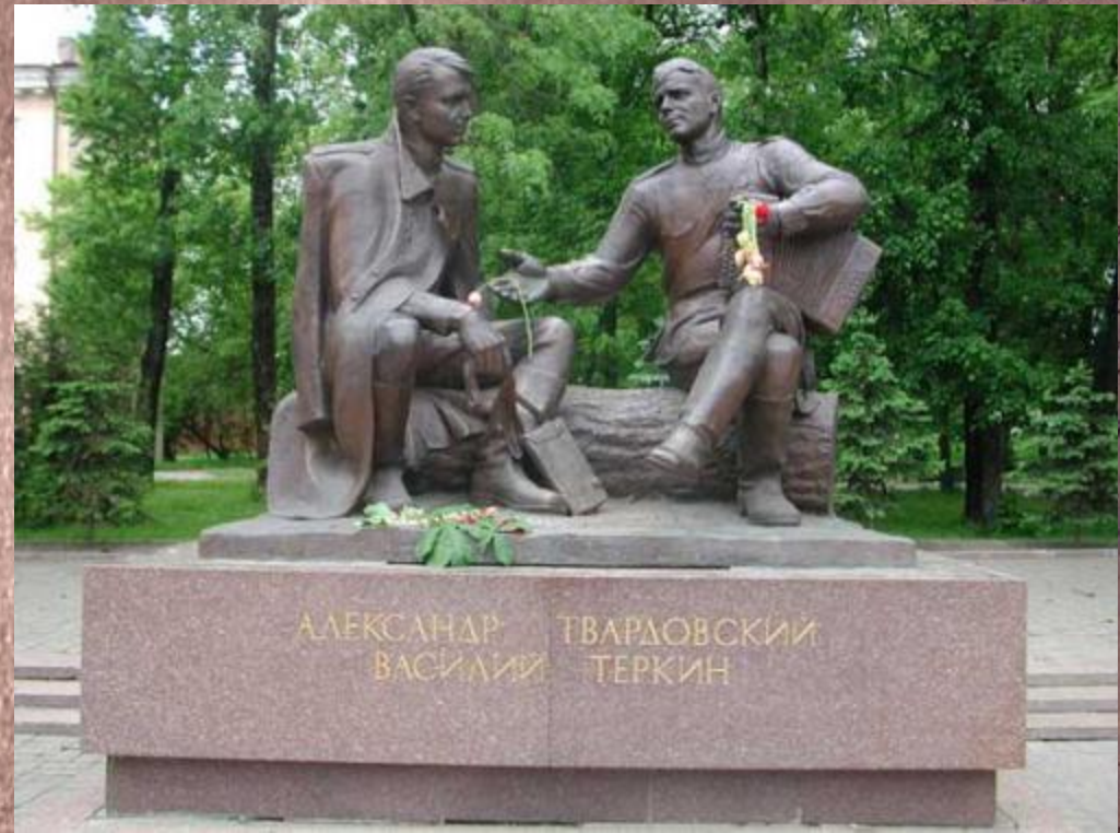
Памятник А. Т. Твардовскому и Василию Теркину в Смоленске (открыт в 1995 году).