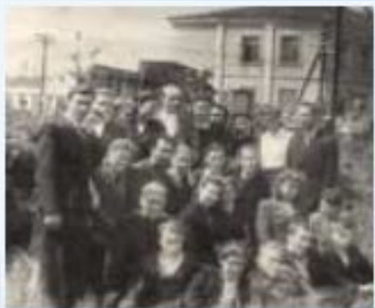
Первый набор вечернего отделения УЭТ 1947 год

На основании приказа Министерства топлива и энергетики РФ в 1996 году техникум преобразован в Уфимский энергетический колледж