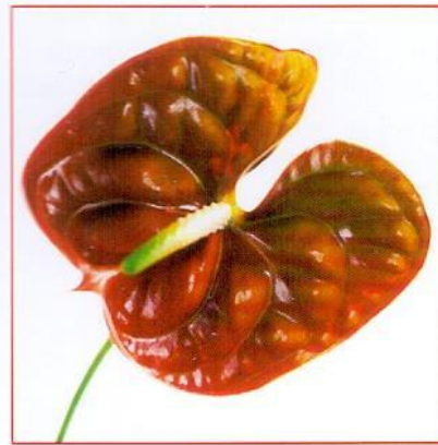
лаковая Пример: антуриум