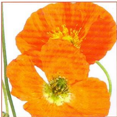
шелковая Пример: мак