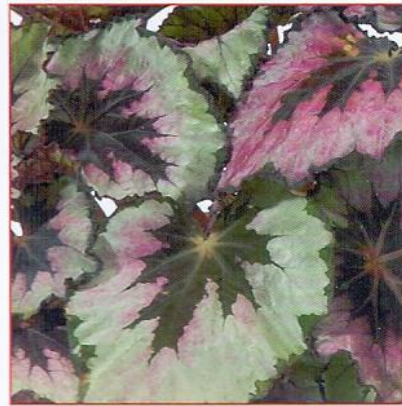
парчовая Пример: лист бегонии рекс