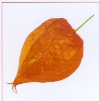
бумажная Пример: физалис