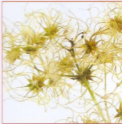
шерстяная Пример: семена клематиса