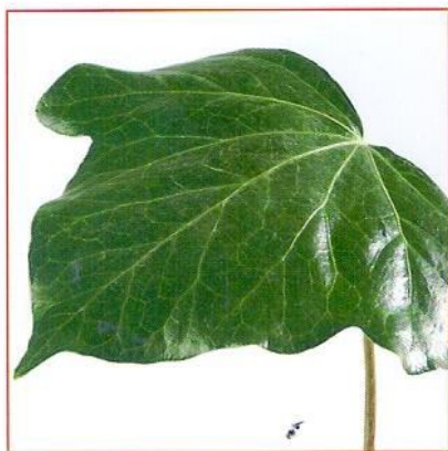
кожаная Пример: лист плюща