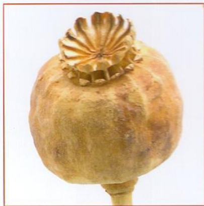
деревянная Пример: сухая головка мака