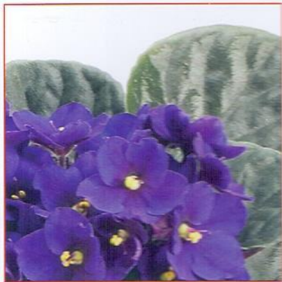
бархатная Пример: узамбарская фиалка