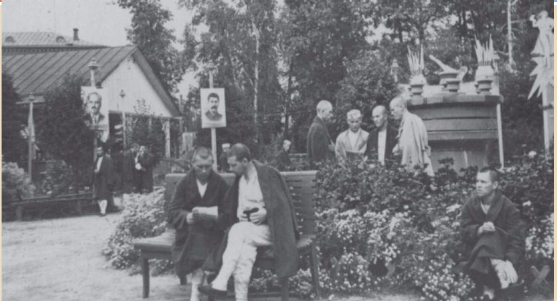
Прием раненых в костромском госпитале, 1941 год.

В годы войны на территории нашей области было сформировано около 50 госпиталей