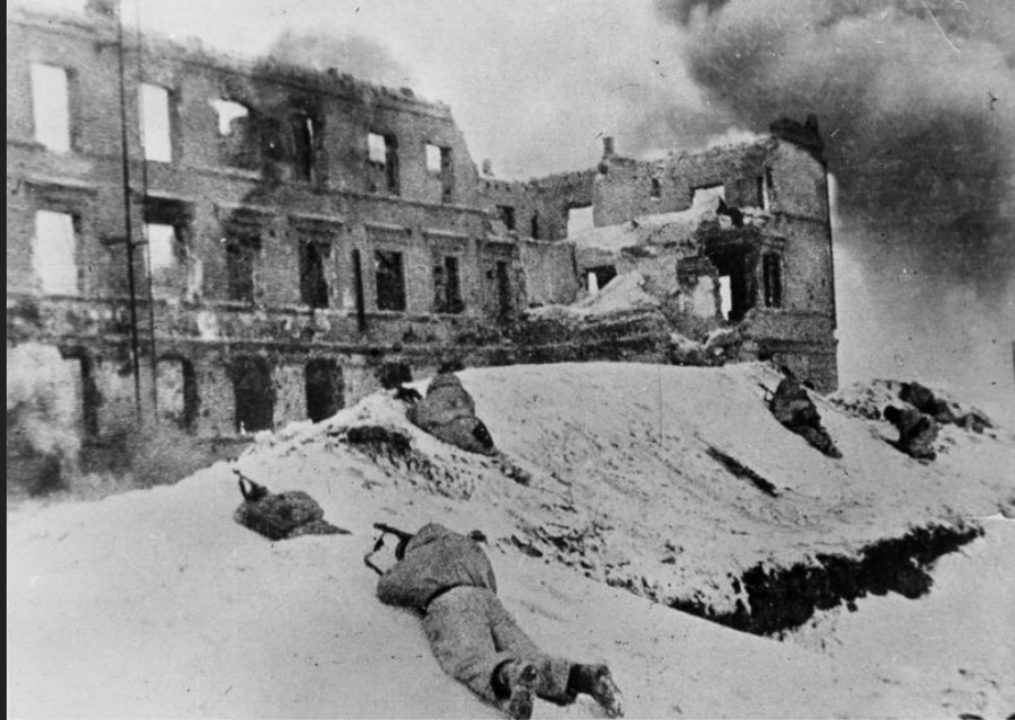
Bundesarchiv, Bild 183-P0813-308 Foto: o. Ang., 1. Januar 1943

Одно из самых кровопролитных сражений 2-й мировой войны закончилось победой Советских войск. Мы выстояли перед всеми трудностями этой битвы и склонили чашу весов в свою сторону тем самым положив начало победе Красной армии над фашистской Германией. ход истории поменялся.