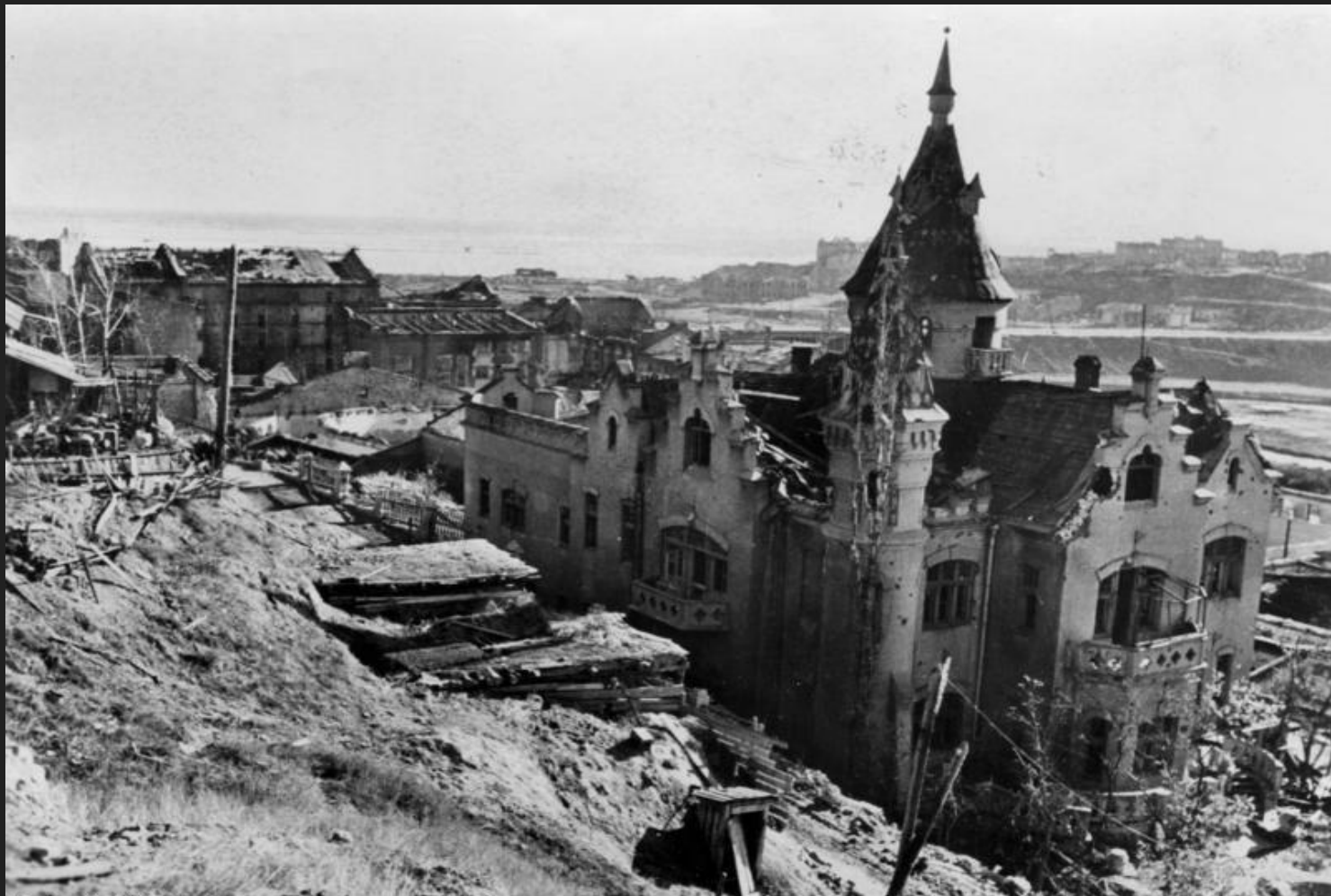
Bundesarchiv, Bild 183-B22800 Foto: Heine | November 1942