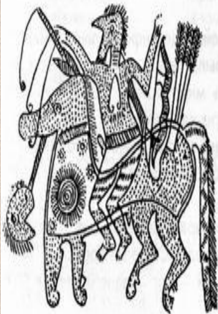
Изображения скифских воинов на кобанском бронзовом поясе