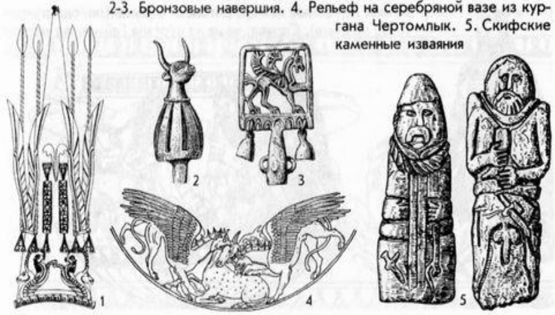
1. Золотой головной убор царя саков (курган Иссык в Казахстане). 2-3. Бронзовые навершия. 4. Рельеф на серебряной вазе из кургана Чертомлык. 5. Скифские каменные изваяния