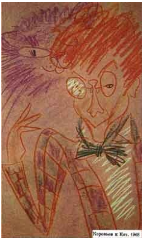
Королев и Кот, 1968