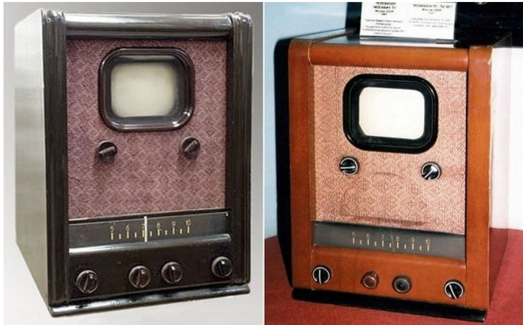
Первый советский телевизор Б-2 (1932 г)