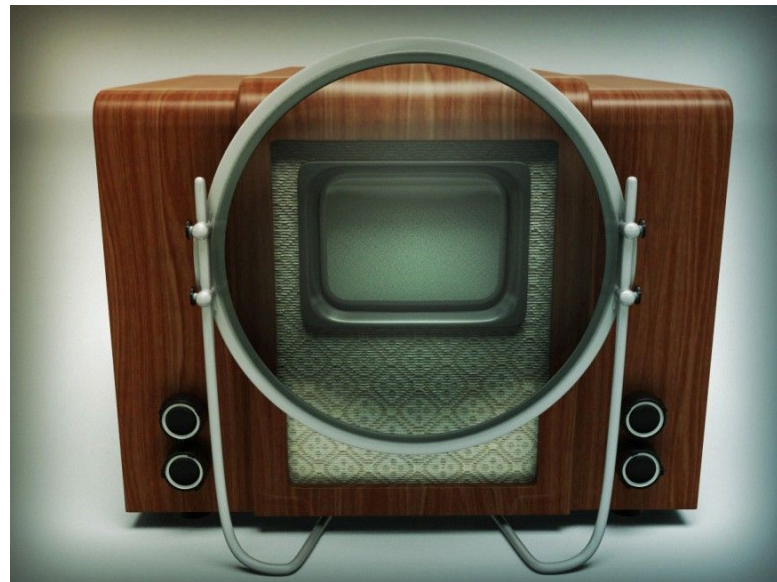
Первый электронный телевизор -КВН 49 (1949)