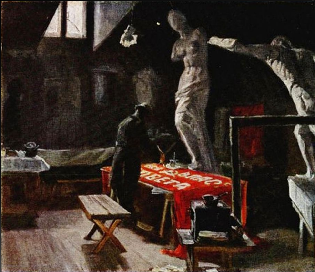
Н. В. Терпсихоров, "Первый лозунг" 1924 г