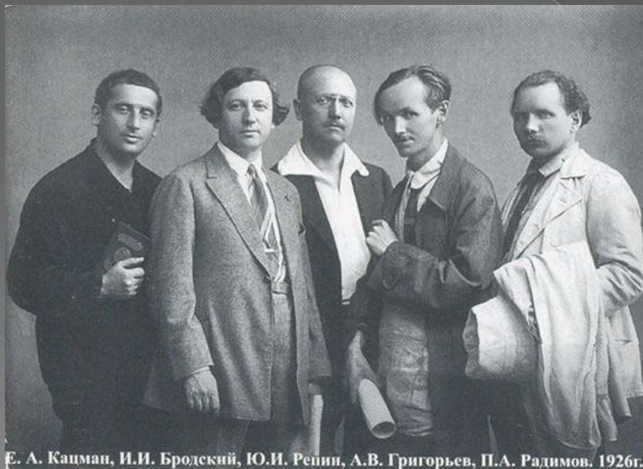
Е. А. Кацман, И.И. Бродский, Ю.И. Реппин, А.В. Григорьев, П.А. Радимов. 1926г.