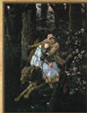
ИВАН-ЦАРЕВИЧ НА СЕРОМ ВОЛКЕ (1889)