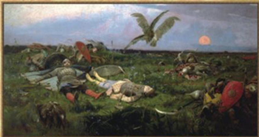
ПОСЛЕ ПОБОИЩА ИГОРЯ СВЯТОСЛАВИЧА С ПОЛОВЦАМИ (1889)