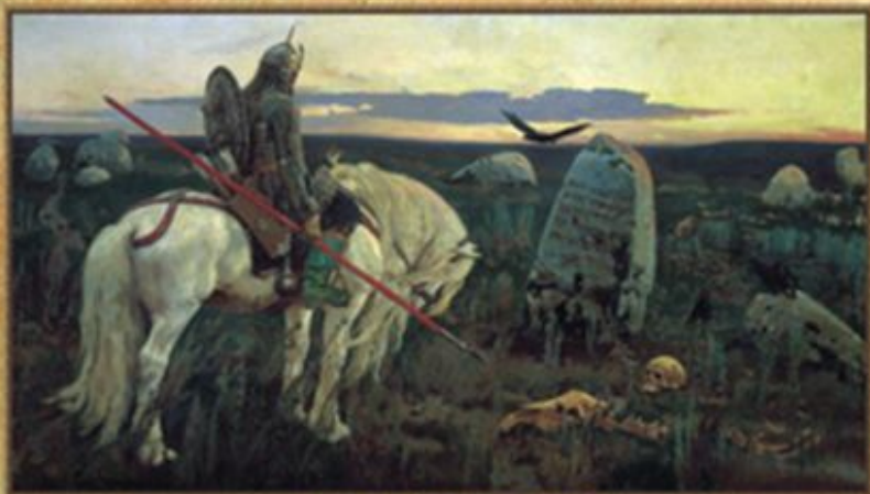
БИТЯЗЬ НА РАСПУТЬЕ (1882)