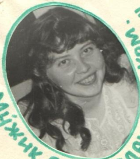
"Волшебница" Музык О.Р. - редактор ком. -="воспитатель Д/с."-