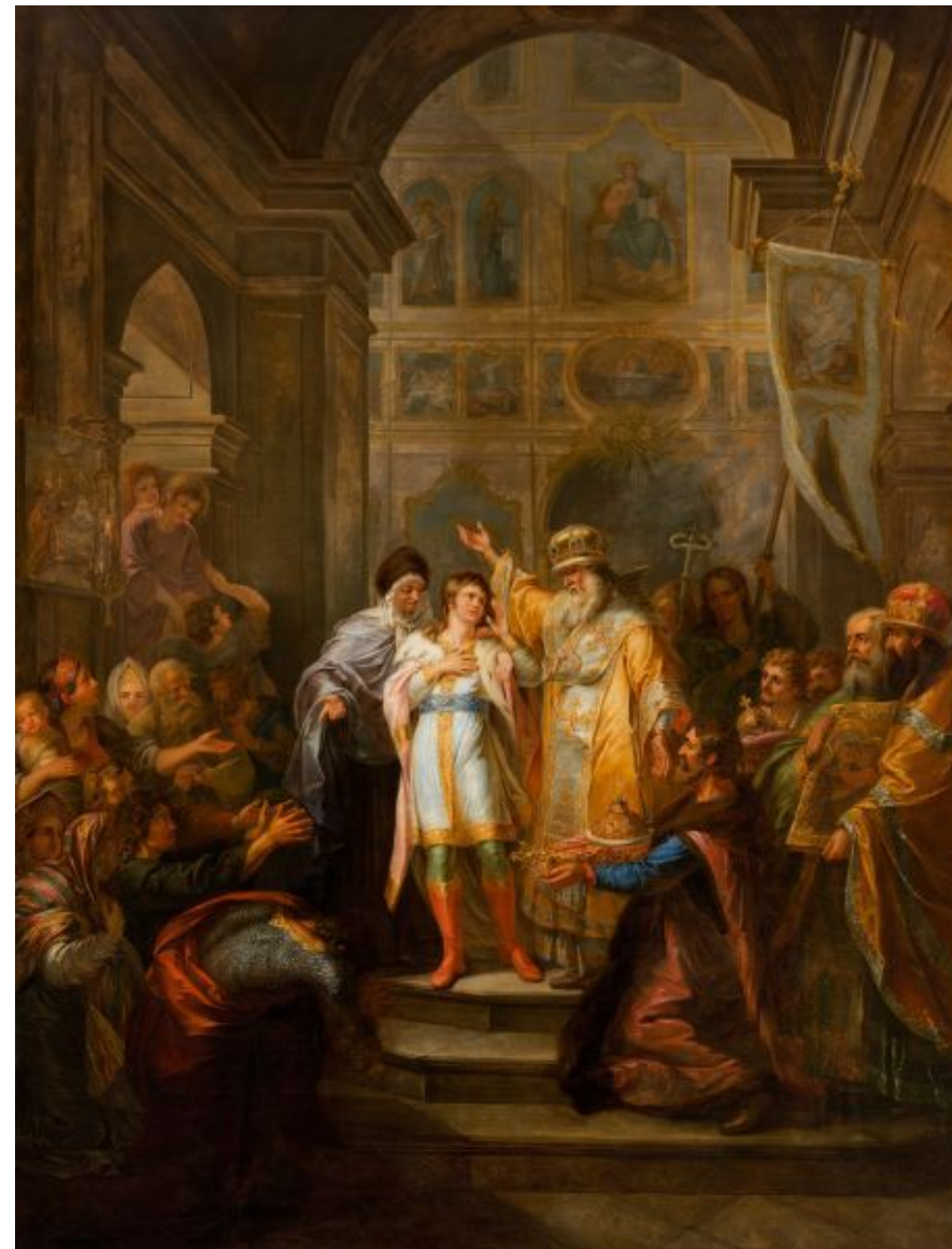
Г. И. Угрюмов «Призвание Михаила Федоровича Романова на царство 14 марта 1613 года»