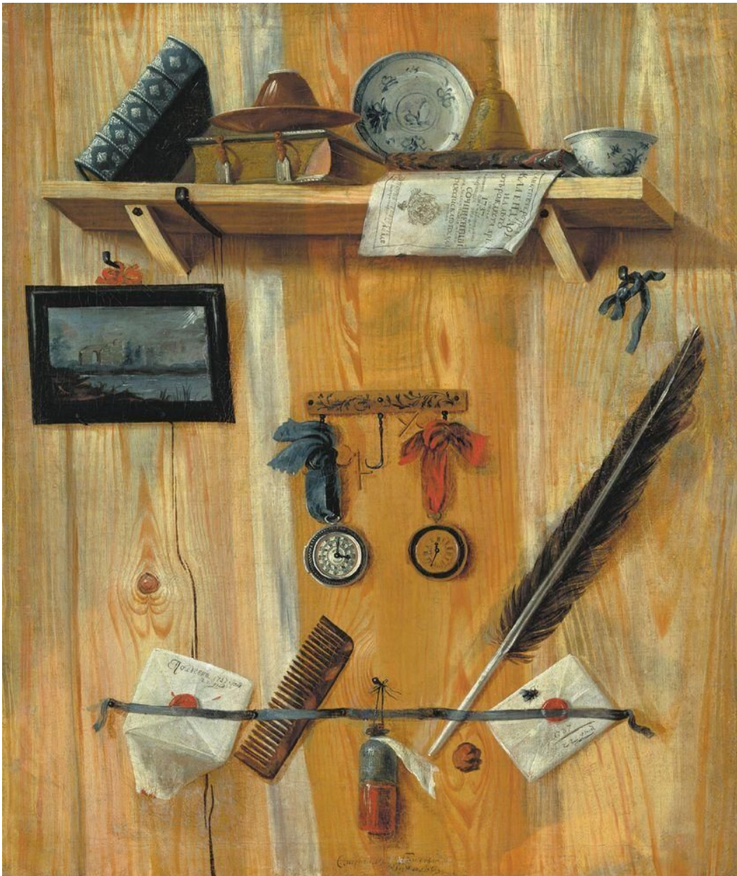
Г. Теплов. Натюрморт (1737)