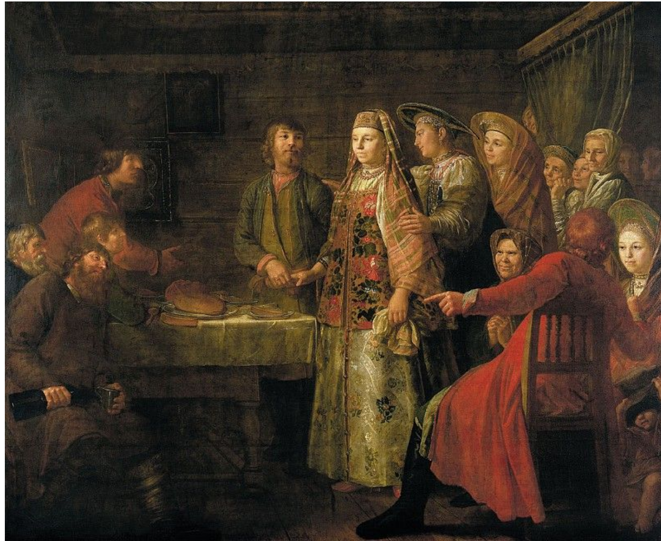
М. Шибанов. «Празднество свадебного договора» (1777)