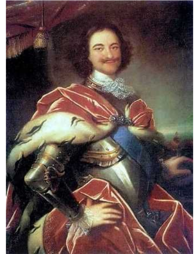
И. Н. Никитин «Портрет Петра I»

Парсуна – портрет реального лица (царя, боярина, митрополита, иногда даже купца) , выполненный иконописными приемами. Парсуной не изображали простых людей, а изображали только каких то очень известных персон, или персон известных в своём округе.