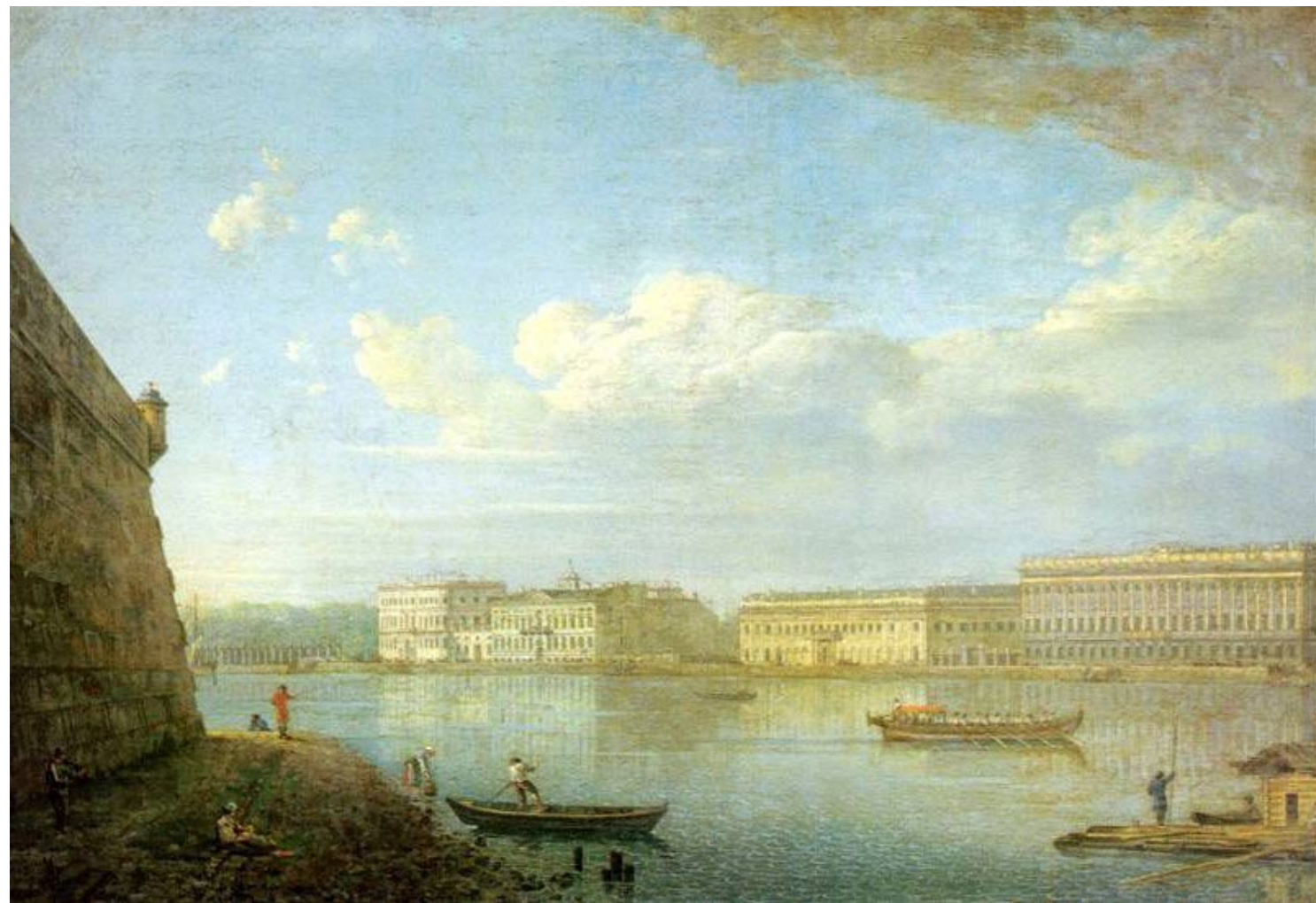
Ф. Алексеев. «Вид Дворцовой набережной от Петропавловской крепости» (1794)