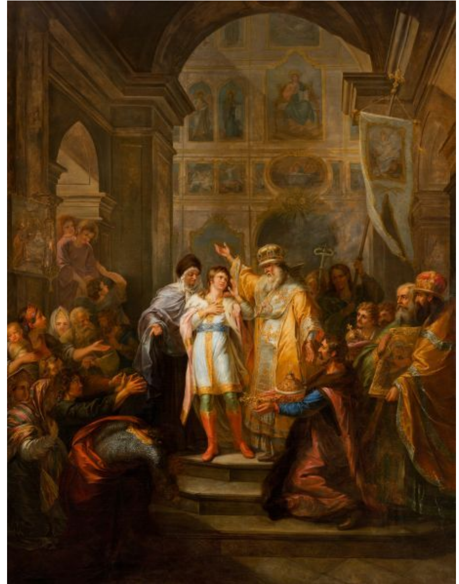
Г. И. Угрюмов «Призвание Михаила Федоровича Романова на царство 14 марта 1613 года»