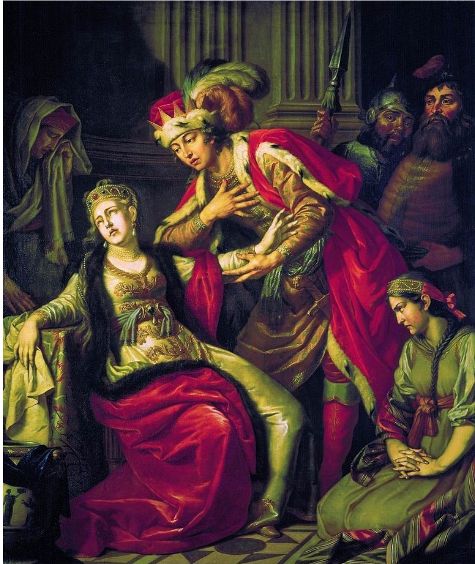
А. Лосенко «Владимир перед Рогнедой»