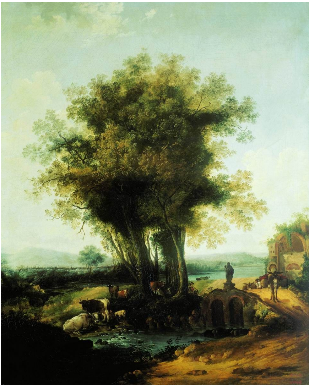
С. Щедрин. «Полдень» (1778)