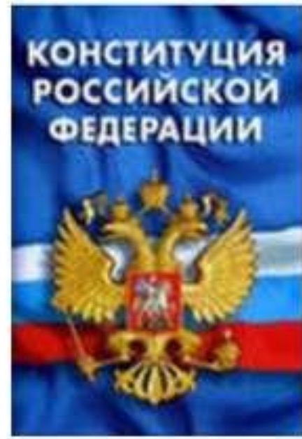
Основной закон РФ