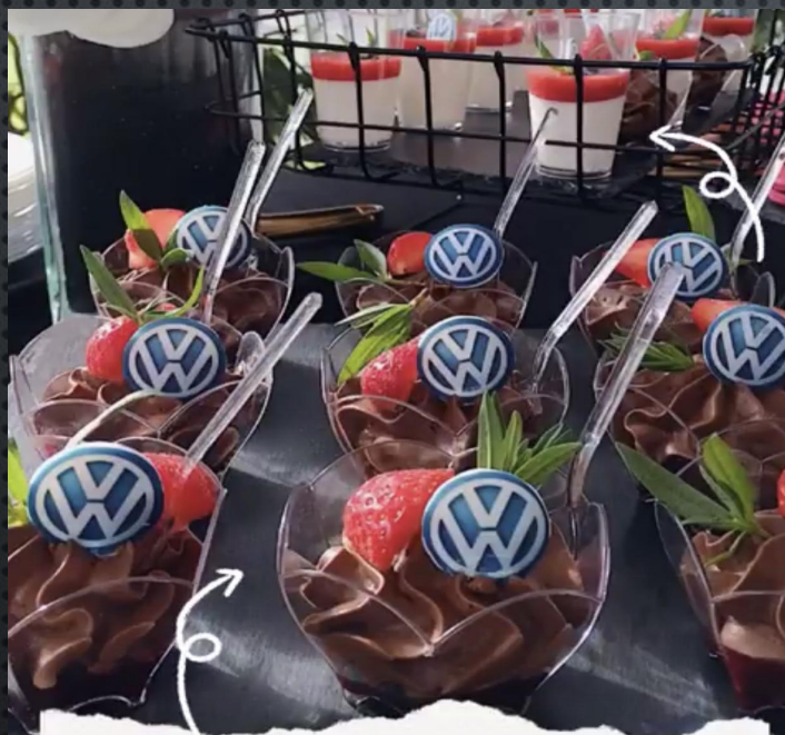
Французский шоколадный мусс Панакота с клубничным пюре