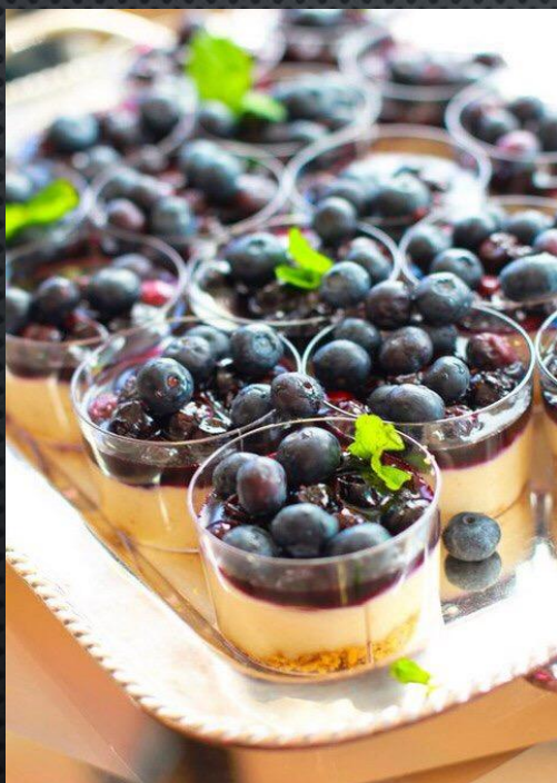
КРЕМ-ПЛОМБИР С ЯГОДАМИ