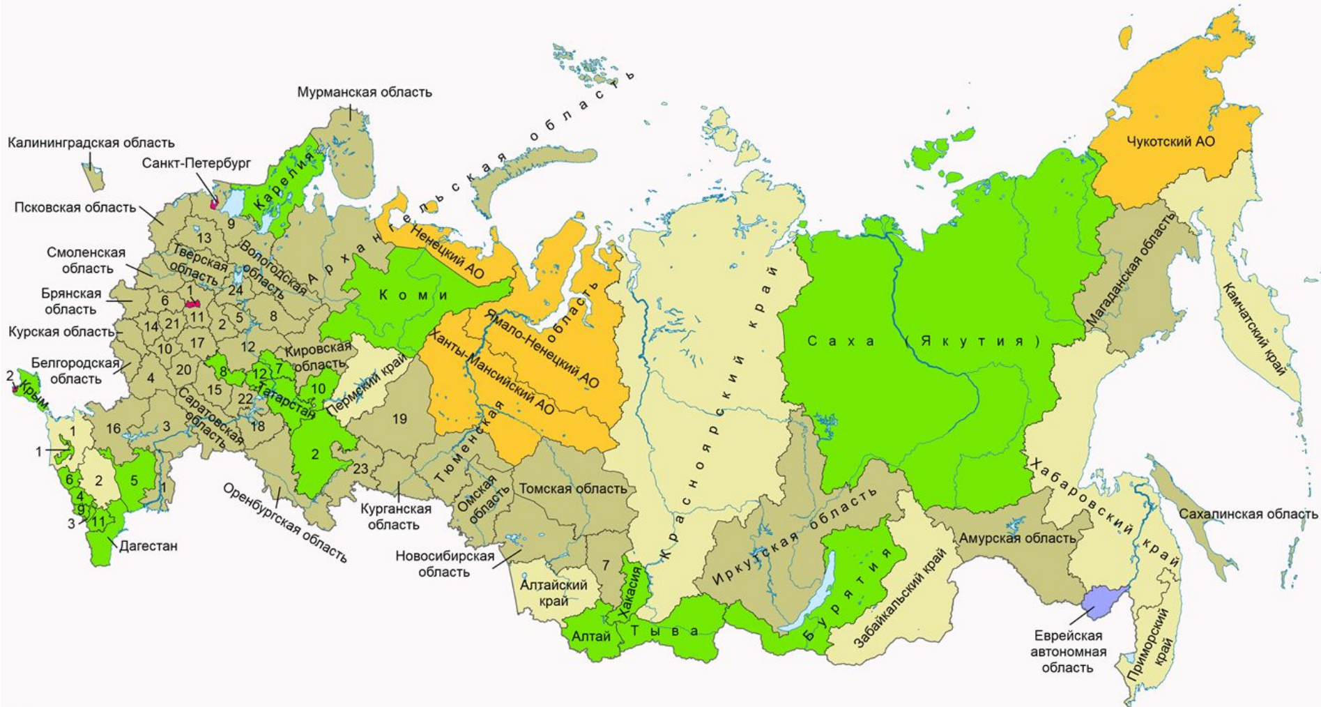
Обозначения на карте: