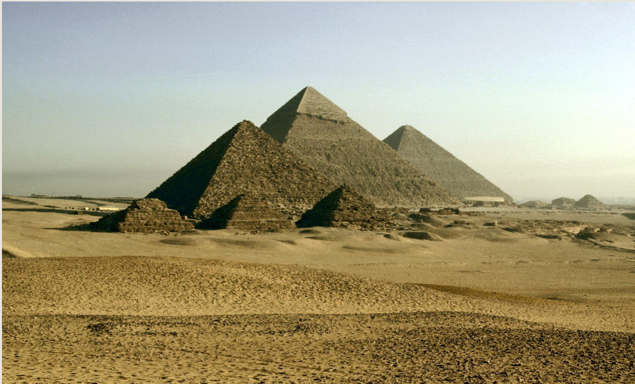
Великие пирамиды в Гизе