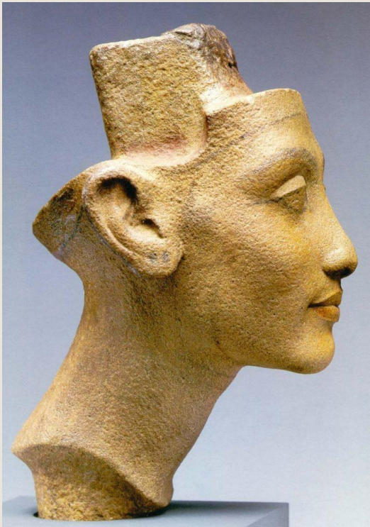
Скульптурный портрет супруги Эхнатона - Нефертити