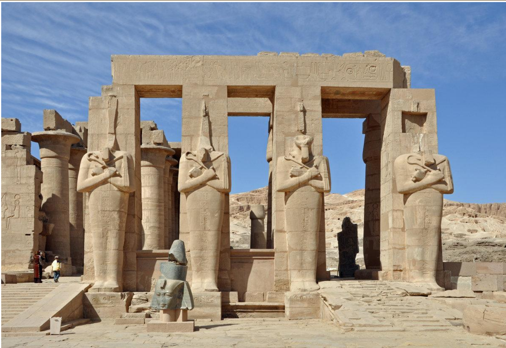
Луксор близ Фив