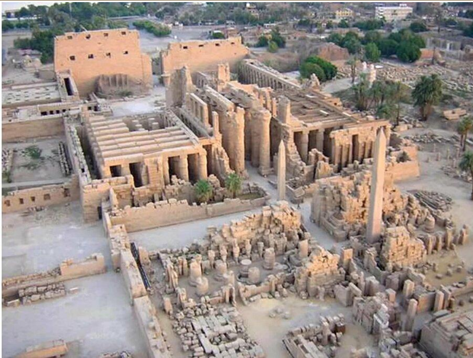
Храм Амона Ра в Карнаке